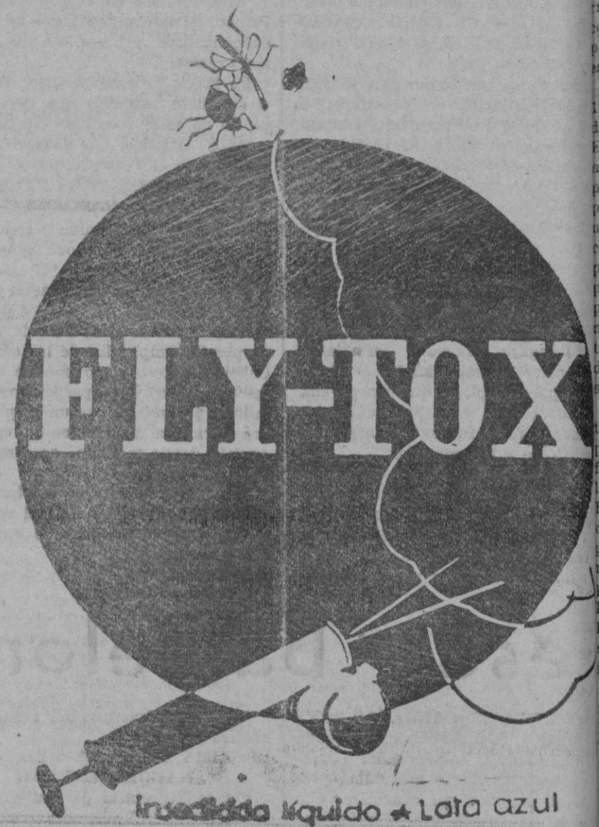
Insecticida líquido * Lata azul

P. Progreso, 28 (Tranvías y Autobuses a la puerta)