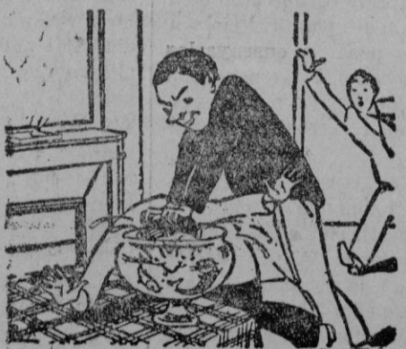
—Axi comprendrás com és que dins l'aigua els peixos no parlan.