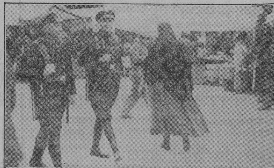
Llegada de los guardias de Asalto venidos de Valencia. Una multitud de curiosos acudió al muelle.