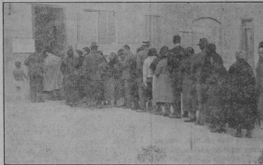
Cola de votantes a la puerta de un Colegio electoral de Palma. Otra cola de electores a la puerta de un Colegio de las afueras.

interviu con el señor Gil Robles, a quien presenta como un hombre lleno de moderación y de prudencia que busca siempre sus frases para no herir a nadie.