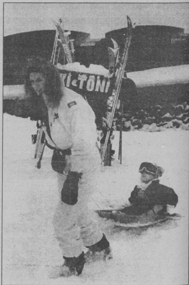
Sarah Ferguson tira del trineo donde va montada su hija mayor, la princesa Beatriz, durante sus vacaciones invernales en la estación austriaca de Zurs, localidad a la que se ha desplazado para continuar sus días de descanso después de haber estado en la estación alpina de Saint Moritz (Suiza) junto con un grupo de amigos, mientras que sus hijas quedaban al cuidado de su esposo, el príncipe Andrés. La duquesa de York ha aprovechado estos días para acompañar a su madre, Susan Barrantes, a la cual no vio con motivo del bautizo de su hija pequeña, ya que, debido al fallecimiento de su segundo marido, el argentino Héctor Barrantes, no consideró conveniente asistir.

Las marismas de Santoña, con sus aproximadamente 2.000 hectáreas de superficie son la más importante zona de invernada de aves acuáticas de toda la costa cantábrica. Se sitúan en la confluencia de varios estuarios que forman amplias zonas de lodos intermareales y sistemas de dunas costeras. Su importancia internacional se base en la invernada del Anade Silbón, Zarapito Real, Zarapito Trinador y Espatula). Pese a ello, los gobiernos cántabro y español han permitido, alentado, e incluso llevado directamente a cabo alteraciones artificiales que han degradado gravemente las marismas.