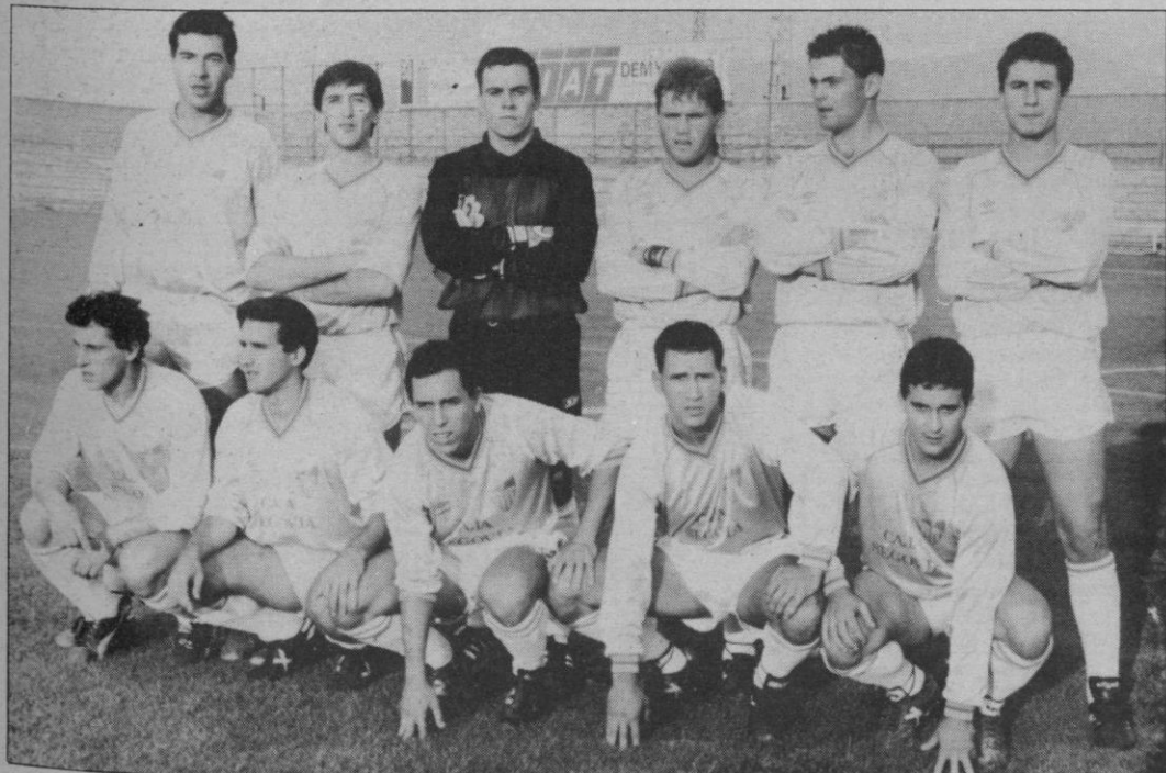
“Que demuestren su valía en el campo y luego que pidan”