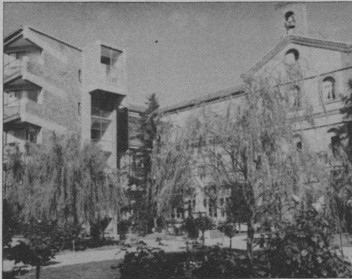
Antigua residencia de las Hermanitas de los Pobres

Las Hermanitas de los Pobres ceden el uso de su residencia de la Avenida Padre Claret