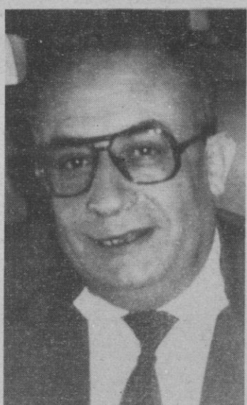
Abu Iyad y Abu Al-Hol