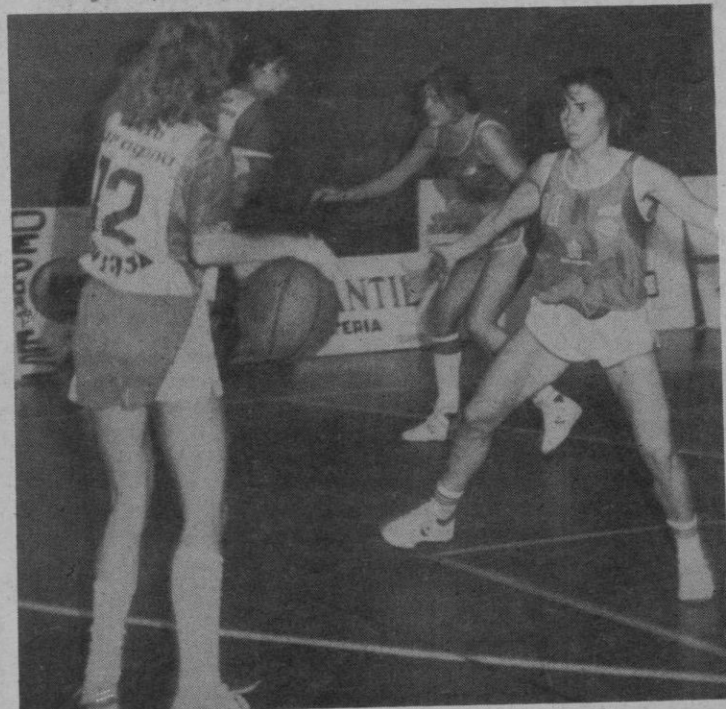
Jesuitinas, a por su primer triunfo

Mañana se disputan los dos últimos encuentros de esta competición que van a tener lugar en el polideportivo municipal de COSLADA. Estos son los partidos: