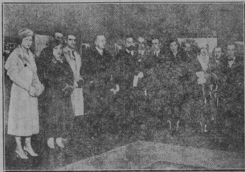
Madrid. — El ministro de Instrucción Pública y otras personalidades en el acto inaugural de la Exposición póstuma del pintor Riaño.