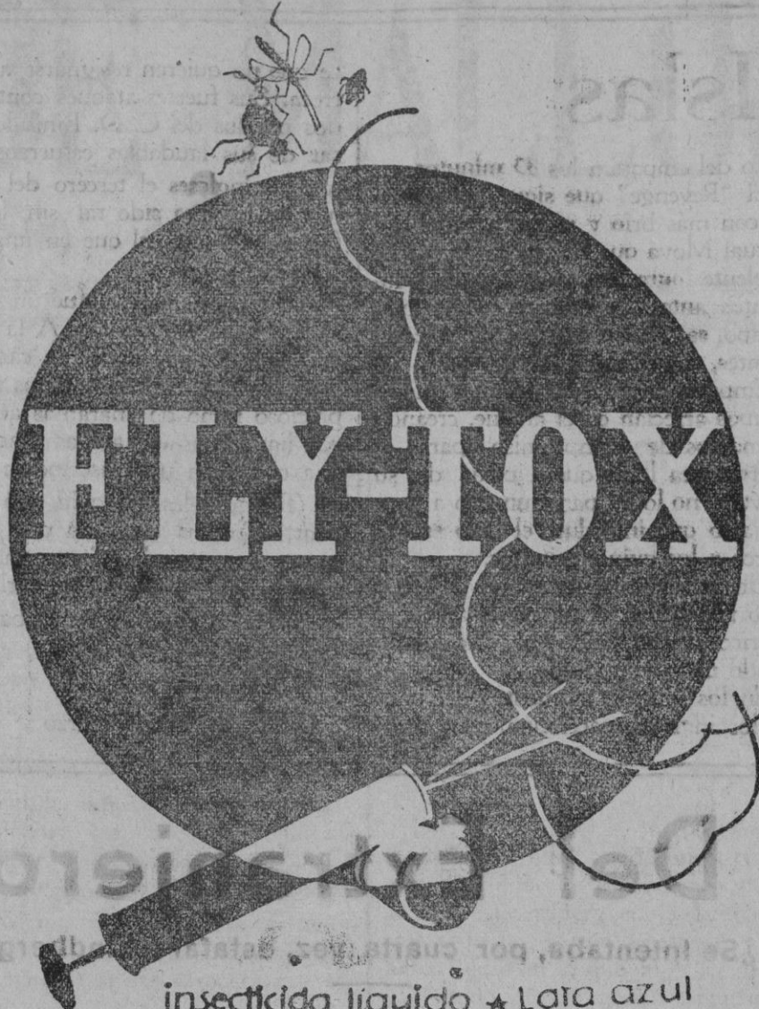
insecticida liquido ★ Lata azul