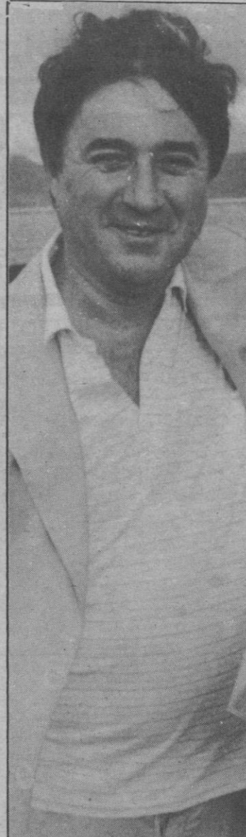
El presidente opina

—Creo que fue por su parte una chiquillada. El realmente está pasando un mal momento