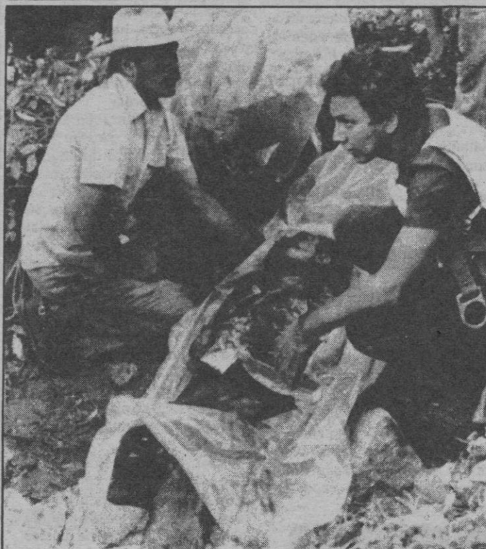
Miembros de la Cruz Roja comienzan a preparar el traslado del cuerpo del piloto del aparato de la compañía mejicana que se estrelló el lunes.

Méjico.— La identificación de los 166 muertos de la peor tragedia aérea ocurría en Méjico,