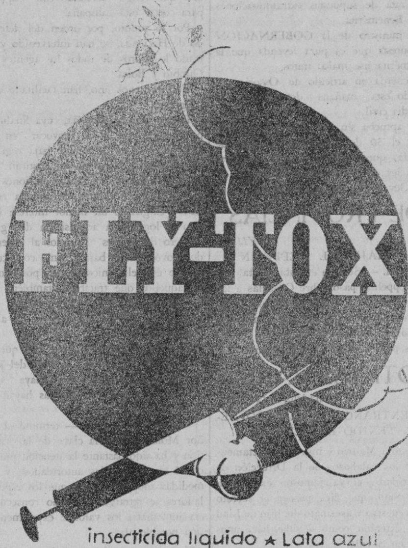
insecticida liquido * Lata azul