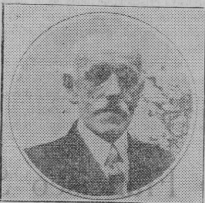
Barcelona. — M. Henri de Regnier, de la Academia Francesa, que ha permanecido varios días en nuestra ciudad.