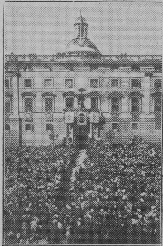
La entrega del Estatuto a Cataluña: Aspecto de la Plaza de la República de Barcelona durante los discursos de los señores Azaña y Maciá.

pos del jefe superior de policía señor Ibáñez ha ofrecido otro rano a la esposa del director general de Seguridad.