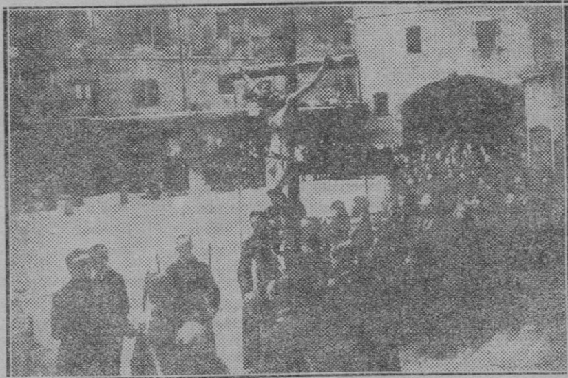
La Semana Santa en Barcelona: La solemne procesión del Vía - Crucis en el patio de la parroquial iglesia de Santa Ana.

La ciudadanía mallorquina una vez más sabrá hacer gala de la cordialidad nativa y espontánea de sus naturales, ofreciéndole al Jefe del Estado español,