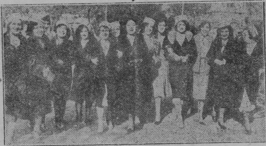
Barcelona. — Grupo de modistillas, vistosamente tocadas con gorritos de papel, recorriendo las calles de la ciudad.