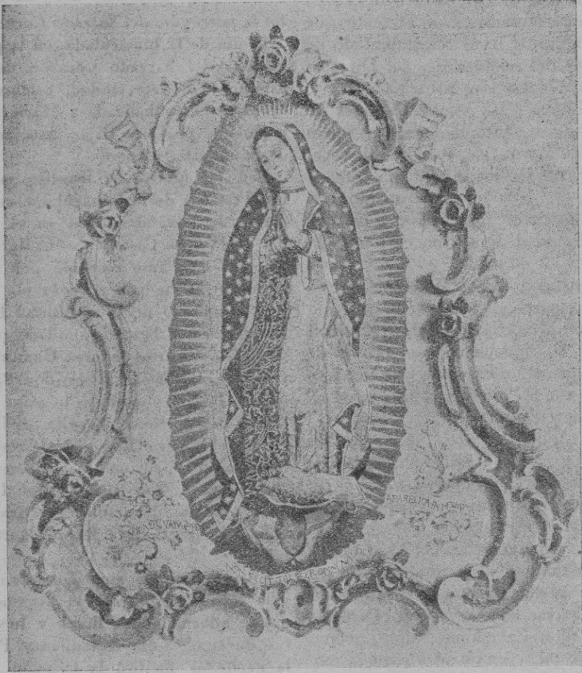
Bello retablo de Nuestra Señora de Guadalupe obra, sin duda, de la segunda mitad del siglo XVIII que guardan los Padres de San Felipe Neri, de Palma de Mallorca.

nació mejicana, amb la qual nos sentim units en el present no sols pels lligams de la fe i de rassa, sinó fins i tot per la mateixa persecució sectària de que som víctimes ells i nosaltres, per tot això volem contar a nostros lectors l'hermosíssima història de la Verge de Guadalupe, i el culte que li reteren els nostros avis en la nostra Ciutat de Mallorca.