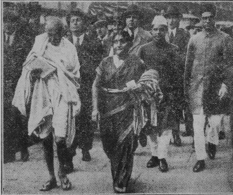
Lceodres. — Mahatma Gandhi, el jefe nacionalista indio, dirigiéndose con su secretaria particular al St. James Palace, donde se celebra la Conferencia de la Tabla Redonda.

"Los concejales que suscriben proponen al Ayuntamiento que, al objeto de poder continuar ofreciendo trabajo a