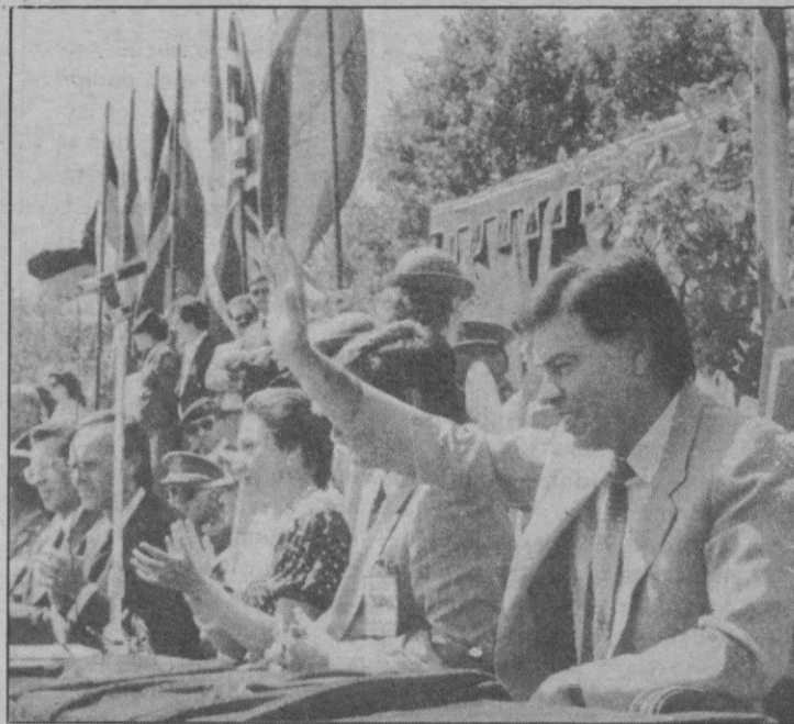
Ayer por la mañana se inauguraron en el parque Puerta de Hierro, de Madrid, los V Juegos Europeos para Minusválidos Psíquicos, que se celebrarán hasta el próximo jueves. Los actos comenzaron en la plaza de la Villa, donde el alcalde, Enrique Tierno, encendió la llama de la amistad que varios niños condujeron hasta el parque. Allí, el presidente del Gobierno, Felipe González, procedió a la inauguración de los Juegos en presencia de la Infanta Doña Margarita, Duquesa de Soria, y otras personalidades.

Con trece aciertos han aparecido 205 columnas que repartirán a razón de 333.764 pesetas, mientras que los 3.610 con doce aciertos obtendrán 18.953 pesetas.—Efe.