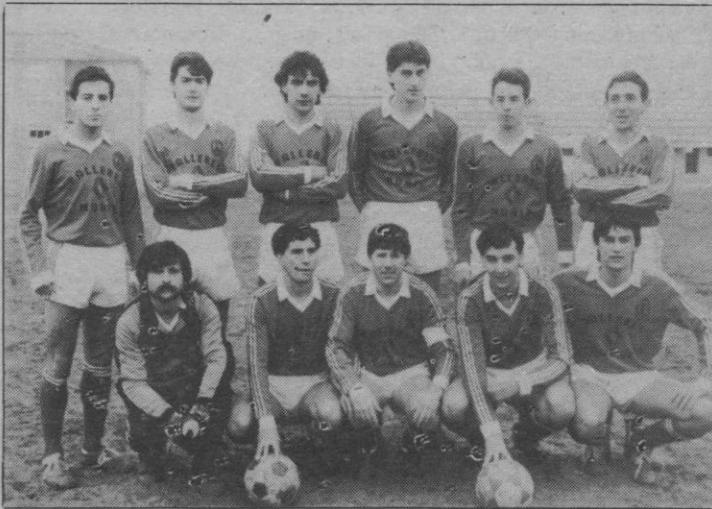
Fuencarral: No mereció ni la «mitad»