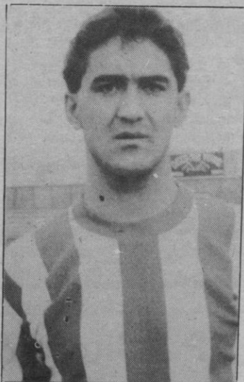
Para: El árbitro no le dejó ni ver el balón

5-0. Minuto 76. «Despiste» en el área con gol de Torres.