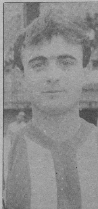
Domingo: Le señalaron un penalty que no hizo

La temporada para el club segoviano no ha podido ser peor. Todo le ha vuelto la «cara». Tras este encuentro, último del calendario oficial, aún le alta por disputar otro, aquél que hubo de suspenderse por la no actua-