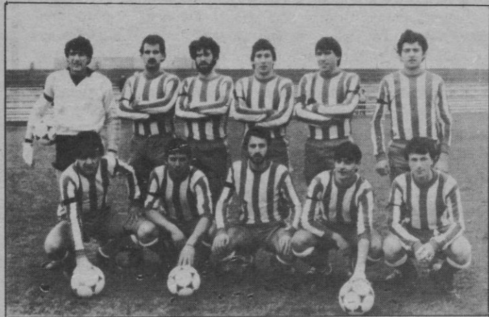
C. D. Acueducto: El «pupas»

res. Los conjuntos presentaron estas alineaciones: