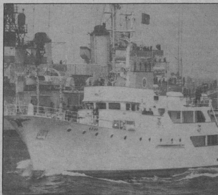
Agentes soviéticos estuvieron espiando —Informa «Diario 16»— los movimientos de los navíos de la Armada Española, en aguas de La Coruña, con motivo del desfile naval celebrado allí con ocasión del Día de las Fuerzas Armadas.— (Más información en pág. 16)