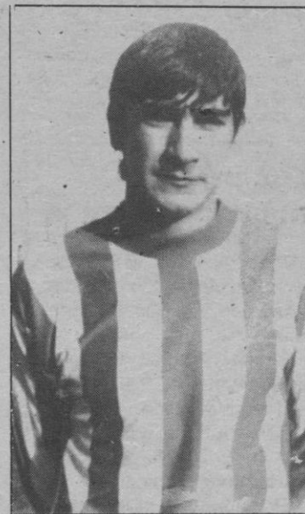
Tinín: Hasta donde pudo

(Es un consejo de EL ADELANTADO DE SEGOVIA)