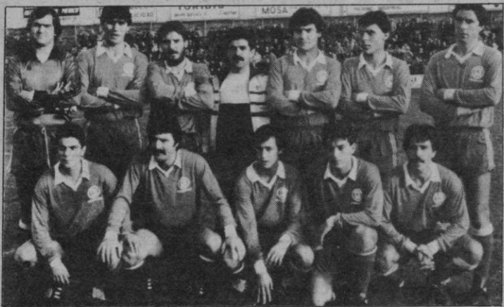
Pegaso: Su peor clasificación