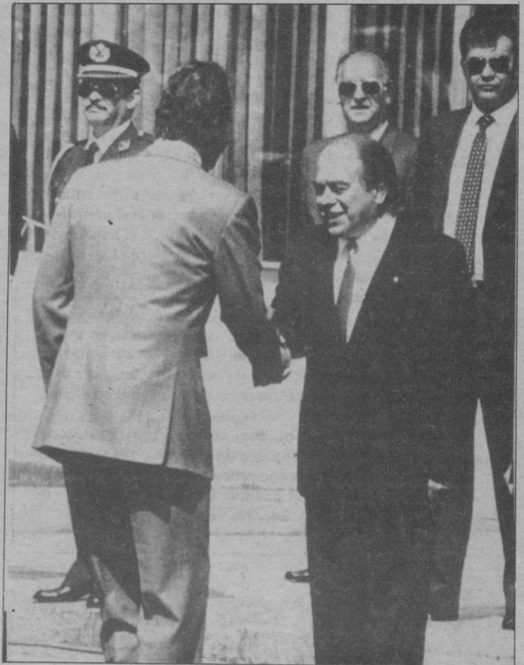
BARCELONA.— Los Reyes de España, Don Juan Carlos y Doña Sofía, iniciaron ayer, en Barcelona, su primera visita oficial a Cataluña desde el restablecimiento de las instituciones autonómicas catalanas. En la foto, Don Juan Carlos es saludado por el presidente de la Generalidad, Jordi Pujol, a su llegada al aeropuerto del Prat.

El Rey estuvo esta mañana en contacto telefónico permanente con la Clínica Universitaria de Pamplona, en la que fue intervenido su padre, el conde de Barcelona, de un pólipa en las cuerdas vocales.—Efe