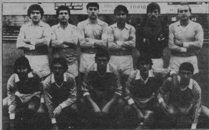
Guadalajara: Muy buena temporada

El ALCORCON ha sido el equipo más «perjudicado» en estos últimos encuentros de li-