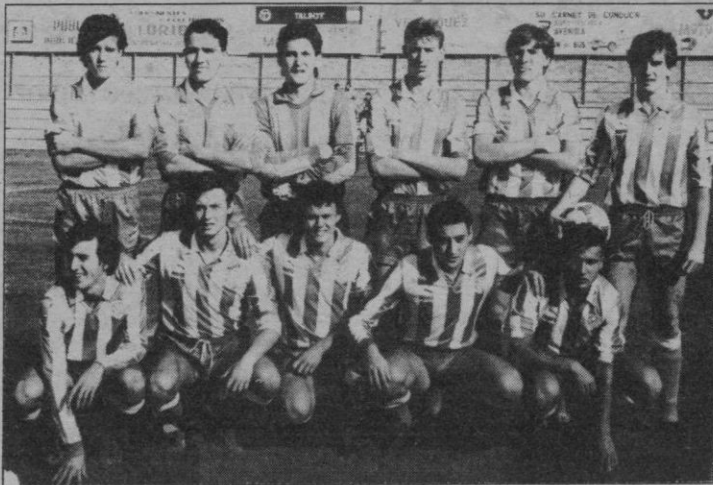
At. Madrileño: ¿Descenso y desaparición?

Debió de ser porque el «fantasma» del descenso se cernía sobre los jugadores del MANCHEGO. Porque hacía muchos partidos —había que remontar-