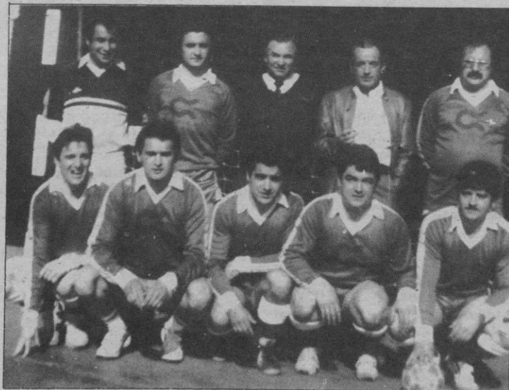
Cindasa, un punto que vale una clasificación

Para no verse relegado, el Bar Centro necesitaba alguno de los puntos en disputa; en un choque jugado de poder a poder en el que abundaron las entradas fuertes pero sin mala intención, el marcador señalaba al finalizar el mismo un empate que dejaba satisfecho a todos, puesto que significaba la clasificación para ambos.