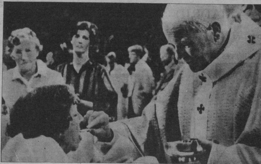
Ayer, tercera jornada de su estancia en los Países Bajos, Su Santidad el Papa recibió en La Haya, en audiencia privada, a la Reina Beatriz de Holanda. Poco antes había celebrado una misa para enfermos y minusválidos (en la imagen) que volvió a congregar a una multitud que acogió con aclamaciones y muestras de afecto la presencia del Santo Padre.

Utrecht (Holanda).— La niebla impidió al Papa Juan Pablo II tomar el helicóptero que esta mañana debía llevarle a Maastricht, donde tenía prevista su llegada a las 09,15 (07,15 gmt) de esta mañana. El Pontífice llegará una hora más tarde en automóvil. Esta anomalía retrasará todo el programa de la tercera jornada de Juan Pablo II en Holanda.— Efe.