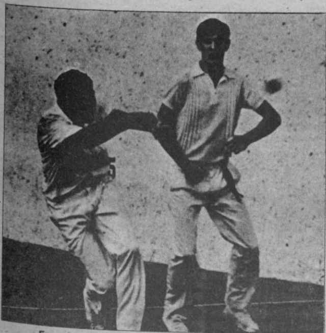
En pelota a mano hace falta trabajar desde abajo