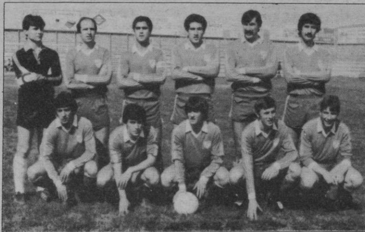
Móstoles: Se salvó

sus «dobles» de la segunda «A», REAL MADRID y AT. MADRILEÑO se jugaban mucho en este partido. Los blancos, aunque jugaban a domicilio, necesitaban la victoria para continuar buscando el primer puesto. Cuestión que han conseguido.