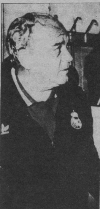
Di Stéfano, cuando era el entrenador del Real Madrid

Valencia.— La directiva del Valencia baraja estos días la posibilidad de contratar a Alfredo di Stéfano como entrenador, siendo mayoritaria esta intención dentro del consejo directivo. Di Stéfano, que ya fue preparador de este club en dos ocasiones con muy buenos