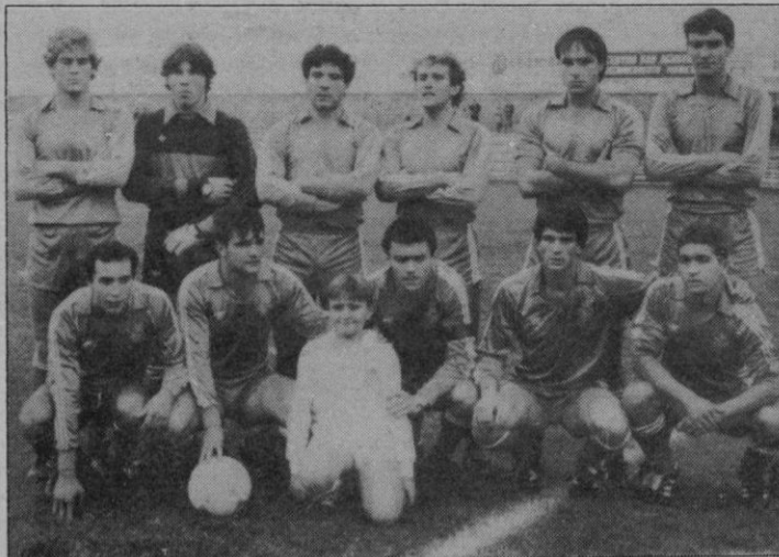
Real Madrid: De nuevo en cabeza