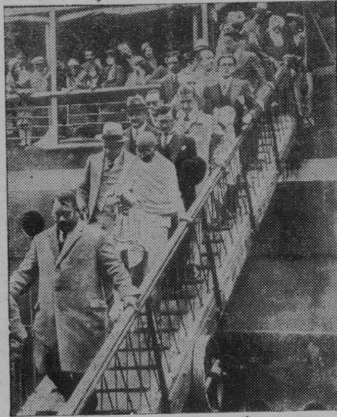
Mahatma Gandhi, el apóstol del nacionalismo indú al llegar a Marsella para dirigirse a Londres donde tomará parte en la Conferencia de la Tabla Redonda.

Reclamado por la Subcomisión parlamentaria de responsabilidades