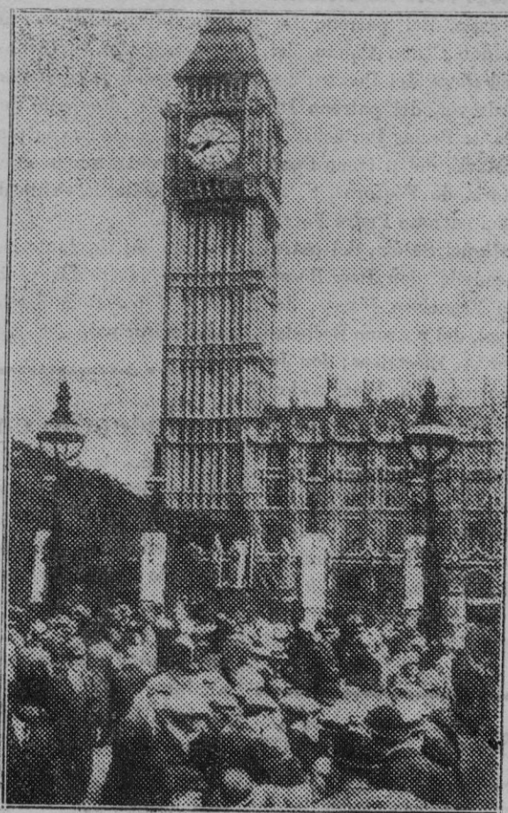
Londres. — Grupos de curiosos estacionados ante el Palacio del Parlamento, esperando la entrada en la Cámara de los Comunes para asistir a la primera sesión parlamentaria que celebró el nuevo Gobierno.