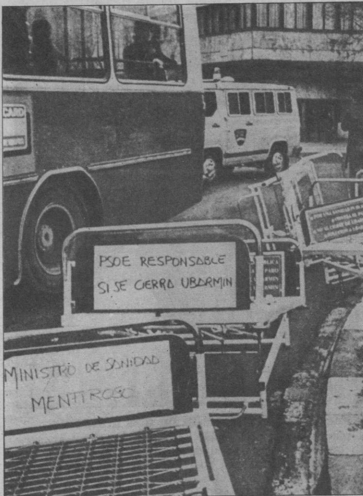
Trabajadores de la clínica Ubarmin, de Elcano (Navarra), arrojan veinte camas del centro sanitario en una plaza de Pamplona frente a la Delegación del Gobierno, para protestar contra el posible cierre de la clínica. Uno de los manifestantes fue detenido por la Policía y más tarde puesto en libertad

Entre las nueve y las diez de la mañana, la intensidad de la nieve arreció considerablemente, y en el centro de la ciudad de Alcoy llegó a cuajar de forma patente.