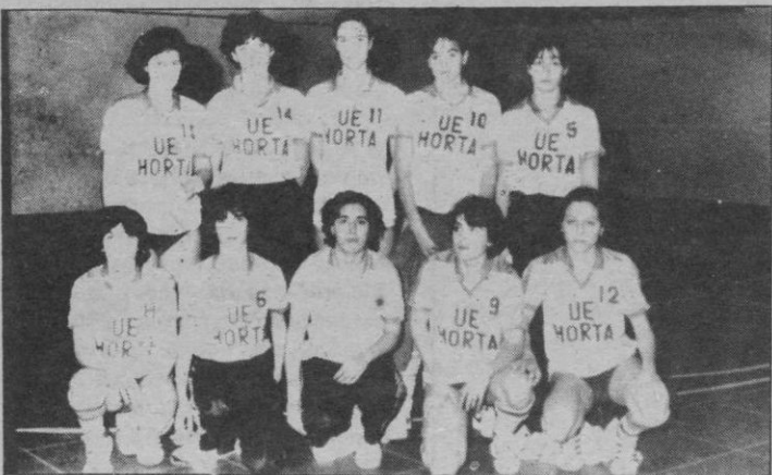
Horta, consolidó su plaza

La reacción de Jesuitinas en la segunda vino de la mano de la presión por toda la cancha. Se consiguió parar el juego local y la igualdad fue lo más desta-