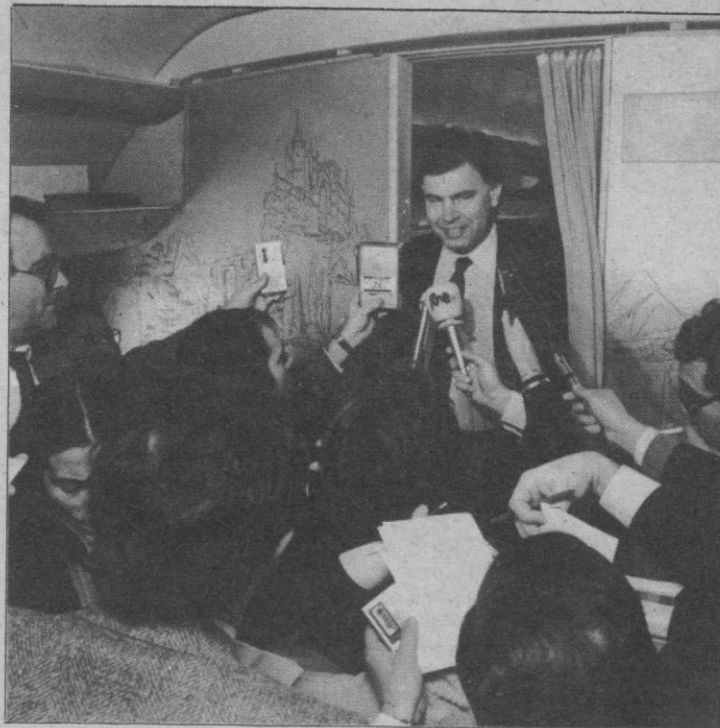
Madrid.—El presidente del Gobierno, Felipe González, conversa con los periodistas en una rueda de prensa improvisada a bordo del avión que le trajo a Madrid tras su visita oficial a Argel. El presidente marchó después por la tarde a Moscú, donde asiste a las exequias del presidente soviético Constantín Chernenko. La crisis económica, la estructuración del Estado y la definición exterior son, por este orden, los principales problemas que actualmente tiene planteados España, según dijo Felipe González ante los informadores. Respondía así a una pregunta sobre la hipótesis de que tuviera que plantear los grandes problemas españoles ante sus colegas europeos que asistirán en Moscú a los funerales de Chernenko.

trasladado a toda la base social del partido en Euskadi esa sensación y, «en este momento —dijo—, todos opinan que no se pueden compaginar los cargos de secretario de organización del PSOE y secretario general de los socialistas vascos».—Efe.