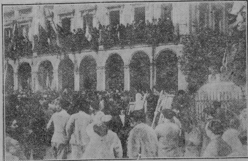
Portugaleta (Vizeaya). — Las banderas de algunas villas de Vizeaya al llegar al Ayuntamiento donde se celebró el acto pro-Estatuto de las Encartaciones.

Gran surtido en géneros para entretimiento. Abrigo seda negro de Crep Sateñ Marrocaín 140 cm. ancho, muy superior, de 10 ptas mt.