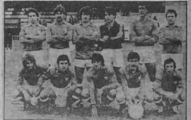
Guadalajara: El Azuqueca se le subió a las «barbas»

El partido de ARANJUEZ tenía un pronóstico ciertamente difícil. ALCORCON es el tercer encuentro que pierde y lo logró ganar con claridad el conjunto local. Con ello la cabeza vuelve a tener muchos «padrinos» y cualquier resultado adverso de los que ahora están arriba puede muy bien poner un líder nuevo.