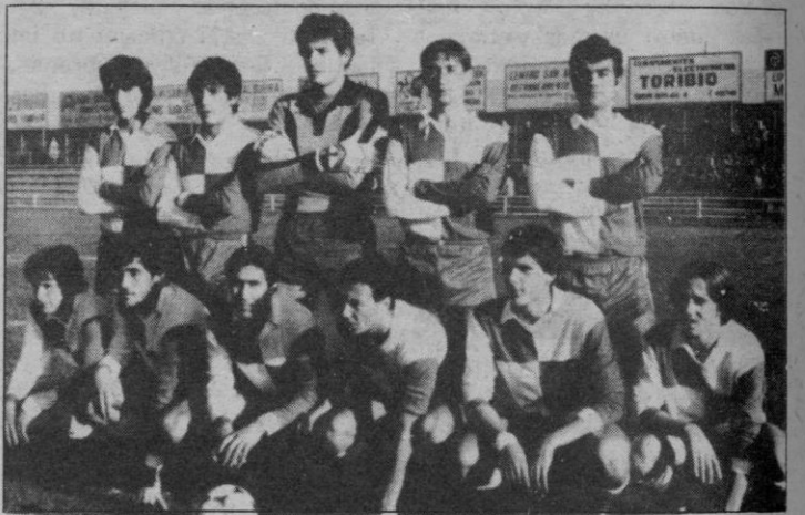
Ciempozuelos: Se «cargó» al Daimiel

Al DAIMIEL le ocurre lo que hasta ahora nos sucedió a nosotros. Atraviesa un mal momento y desde luego tampoco cabía esperar