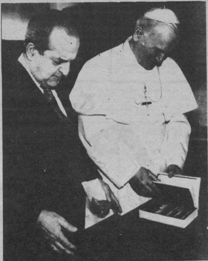
El Papa hojea unos libros del Ministerio de Asuntos Exteriores español que el ministro Morán le entregó como regalo.

La visita oficial que el ministro español de Asuntos Exteriores, Fernando Morán, realizó ayer por la mañana al Vaticano duró una hora más de lo acordado por el protocolo.