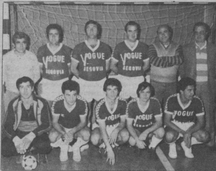
Vogue, primero en el grupo «A»

A destacar, sin duda, la amplia y buena victoria de Don Camilo sobre uno de los equipos que comenzó flojo y continúa por el mismo camino. Es un resultado «redondo» para D. Camilo que le sirve para buscar mejores posiciones. Pipe y Cachuli, los máximos goleadores del grupo en esta jornada. Narizotas continúa de líder, pero en el primer tropiezo Annisa, que no ceja, puede «pasarle». Dos