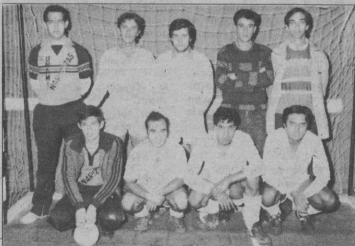
Narizotas-Unami: Aún líder en el «C»