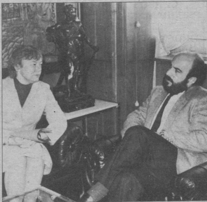
Madrid. — La ministra de Trabajo de Suecia, Anna Greta Leijon, que se encuentra en nuestro país desde ayer, invitada por su colega español, Joaquín Almunia, en el transcurso de la entrevista que mantuvo con éste y otras personalidades, en la sede del departamento del que es titular el Sr. Almunia.

Durante el próximo año se invertirán otros 70 millones de pesetas. El responsable económico financiero de la cooperativa declaró que la producción del aserradero es de 60.000 metros cúbicos de madera —pino «insignis» de Euskadi— al año en ocho horas diarias de trabajo. —Efe