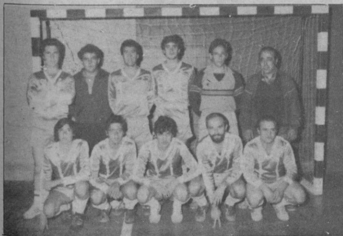
Churrería Mar-Mel: ¡10 goles!

nos resultados. La jornada no ha ofrecido resultados sorpresa y han ganado todos los favoritos.