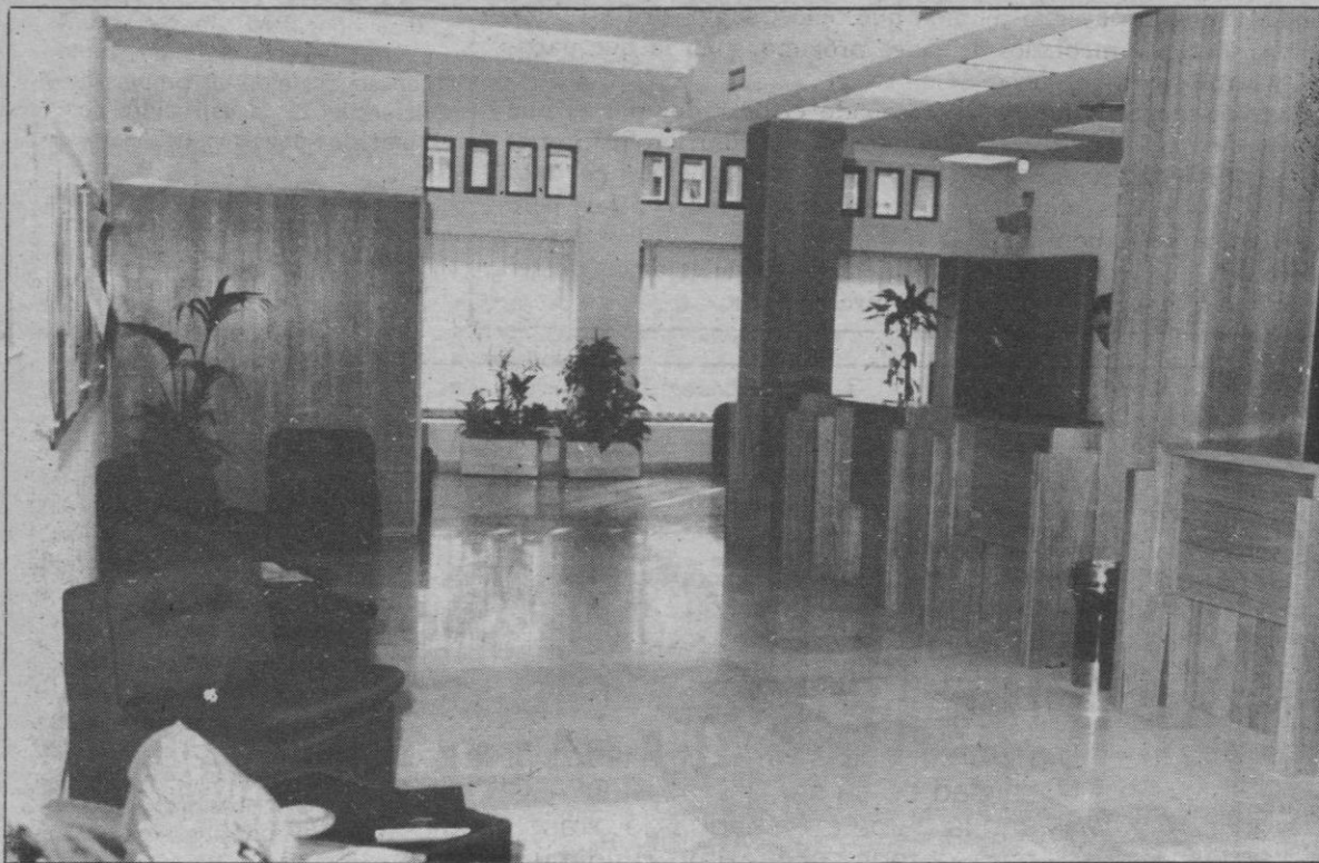
Urbana n.º 9 - Vía Roma

Un año más podemos sentirnos orgullosos de los resultados de la gestión de nuestra Entidad, así como de la solidez de su situación financiera y posición en el mercado del ahorro y del crédito provincial, a pesar de los difíciles tiempos que nos está tocando vivir.