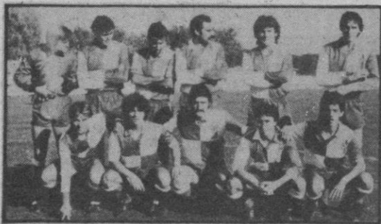
Pegaso, un líder que va a por todo

ARGANDA-PEGASO, a las 5,30. Árbitro: García Gómez.