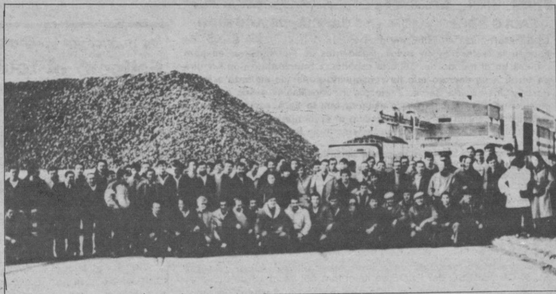
En la foto, el grupo que asistió al primer curso

El Servicio de Formación e Investigación Agraria de la Cooperativa Azucarera «Onésimo Redondo», ACOR, viene organizando con gran éxito diversos cursos de perfeccionamiento del cultivo de la remolacha azucarera.