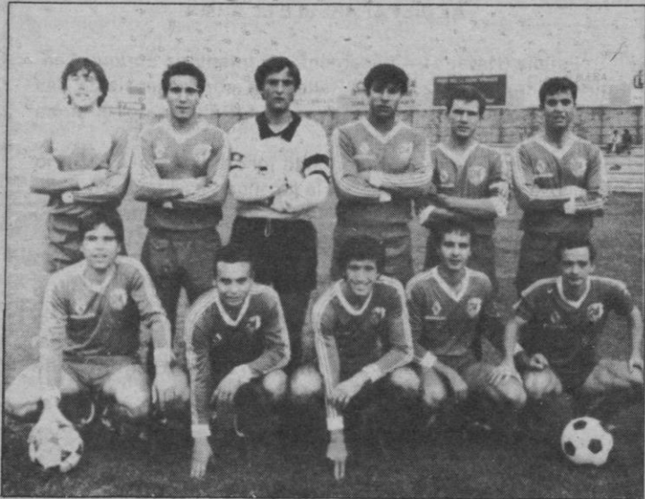
San Fermín, un equipo «asequible» para el Acueducto

equipo. Y puede que lleven razón. El ganar al SAN FERMIN mañana sería un gran estímulo para que los aficionados «subieran» hasta LA ALBUERA.