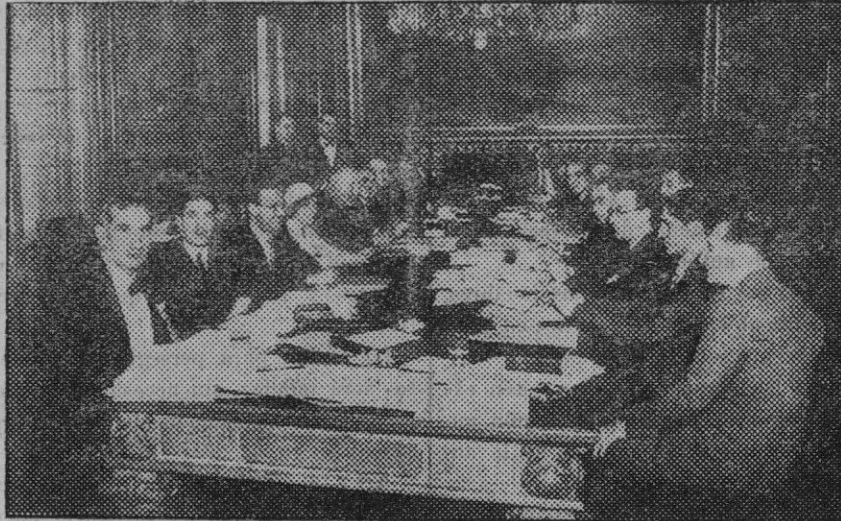
Madrid. — Reunión en el Senado, del pleno de la comisión encargada de redactar el proyecto de Constitución, que ha de ser sometido a la aprobación de las Cortes.