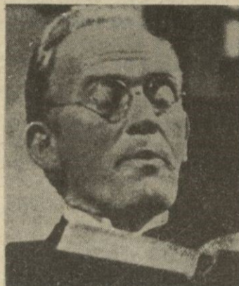
El comportamiento de Hudson (Gordon Jackson) preocupa a los Bellamy.

El misterioso comportamiento de Hudson ha ve-