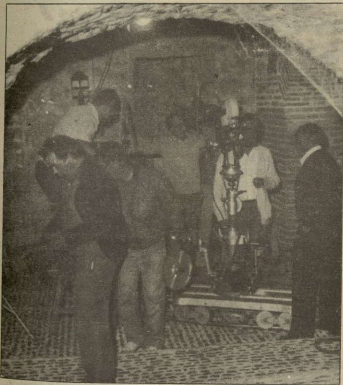
Preparativos para el rodaje de uno de los capítulos de la serie

Banegas (realizador): «Trabajo 18 horas diarias y a veces cuando me acuesto sueño con el trabajo»