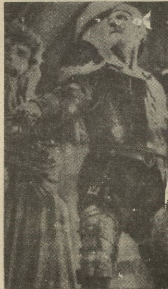
El actor y cantante Fedor Chlapin en su caracterización como Don Quijote.