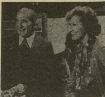
La preparación de un reportaje está a punto de costarle la vida a un periodista de «La Tribuna».

Lance, un joven periodista, incorporado recientemente a «La Tribuna» presencia casualmente un accidente de carrete-