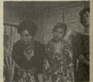
Silvia Pinal, junto a las otras protagonistas femeninas de este largometraje.

Don Marcelino, joven fabricante de chocolates, ha decidido casarse con una mujer que le saque de su retraimiento, de su timidez, de su aburri-