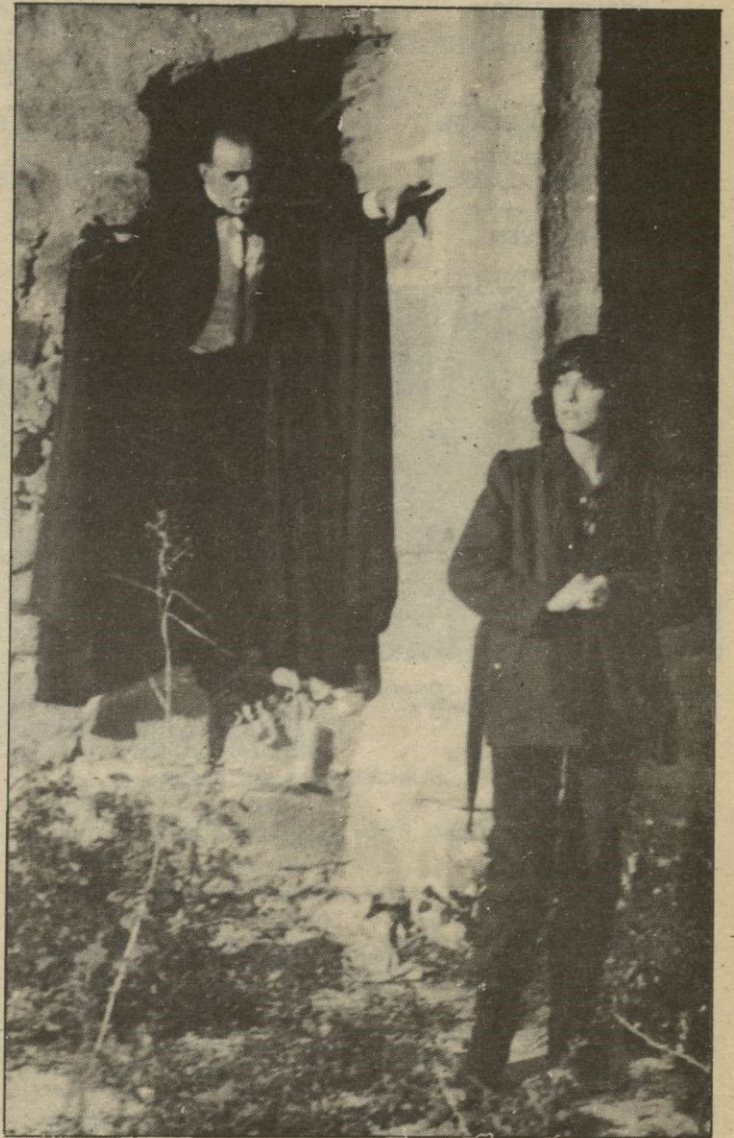
Secuencia de uno de los capítulos dedicados al cine de terror

Es indispensable contar con un equipo que conozca perfec- tamente su cometido, que esté compenetrado contigo y que en cada faceta distinta posea un criterio de decisión. El realiza- dor es el hilo conductor que supervisa aquello que sus cola- boradores han hecho. Todos trabajamos pensando en el fu- turo, introduciendo los cambios paulatinamente, sin prisa pero