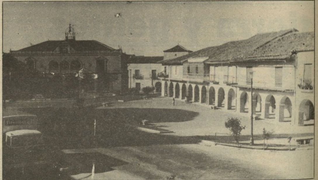
Santa María la Real de Nieva

No obstante, la crisis textil segoviana tuvo repercusiones diferentes en el sector urbano y en el sector rural. La producción provincial estaba repartida en seis localidades de las cua-