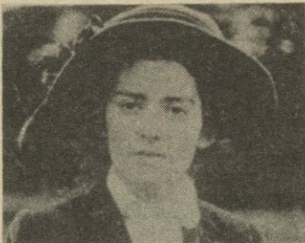
Patricia Quinn incorpora a Cristabel Pankhurst.

Las sufragistas deciden pasar a la acción con el fin de reivindicar sus derechos. Unas incendian buzones de correo y otras rompen escaparates. En cualquier caso y