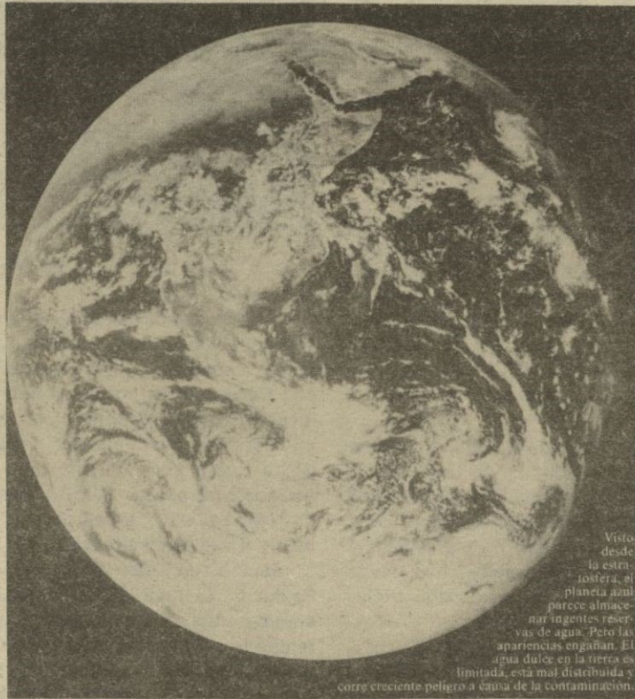
Visto desde la estratosfera, el planeta azul parece almacenar ingentes reservas de agua. Pero las apariencias engañan. El agua dulce en la tierra es limitada, está mal distribuida y corre creciente peligro a causa de la contaminación.