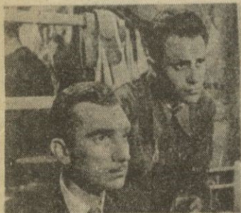
Fernando Fernán-Gómez y José Luis Ozores.

Juan y Carmen son un joven matrimonio que vive de milagro. Ella cose