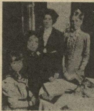
La señora Pankhurst y sus hijos, una familia de feministas.