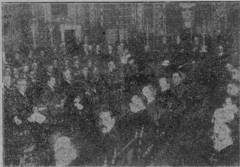
Barcelona. — Asamblea de Diputaciones Provinciales Españolas. Solemne acto de apertura de la Asamblea, celebrado en el salón de sesiones del Palacio de la Generalidad de Cataluña.

París. — El almirante francés M. Darlan, que se halla actualmente en Londres, como delegado de Francia en la redacción definitiva del acuerdo naval anglo-franco-italiano.