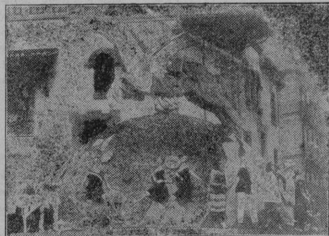
Valencia. — La falla de la calle de las Barcas.