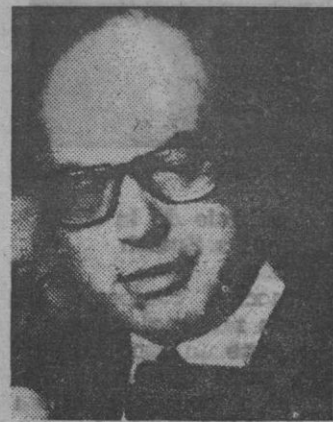
El secretario socialista Bettino Craxi.

Este círculo no se ha resignado a que un socialista ocupe el sillón presidencial, que a juicio del estado mayor del partido, sólo puede