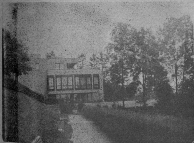
He aquí un ángulo del moderno edificio de la FIFA, en los bellos jardines cercanos a Zurich

Zurich está enmarcada por dos frondosas colinas. En una de ellas, un bello parque natural desde el que se domina toda la ciudad y el lago, se encuentra un moderno edificio, nada llamativo, de un par de plantas, que es la sede oficial de la FIFA (Federación Internacional de Fútbol Asociación). Por cierto que en el país hay una gran afición al fútbol, el deporte que más se practica. Por doquier aparecen campos dedicados a los numerosos equipos existentes.