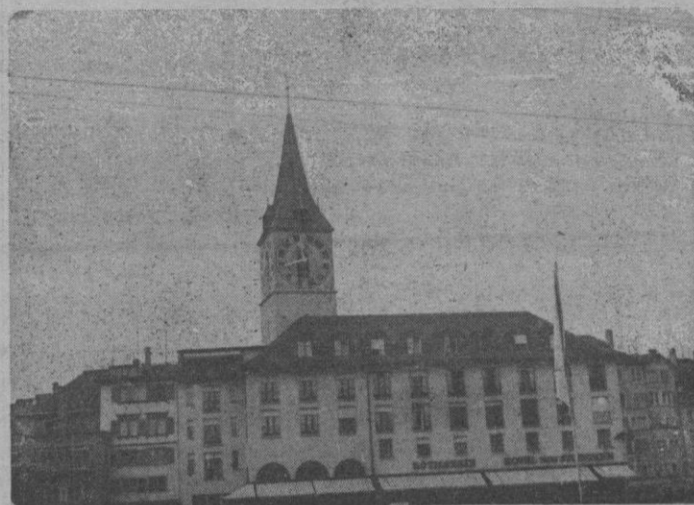
El reloj con esfera más grande de Europa, en un templo de Zurich. Tiene nueve metros de diámetro

cafés, nos señalan el Odeon, que frecuentaba Lenin durante el tiempo que residió en esta capital.