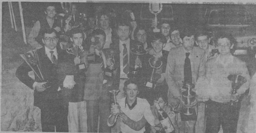
Un grupo de los vencedores en las categorías de jefes y ayudantes.

Con gran brillantez se celebró ayer en nuestra capital el VI Concurso Interprovincial de Coctelería, organizado por el Montepío de Camareros de Segovia, con el que colaboraron diversas marcas comerciales y entidades oficiales.