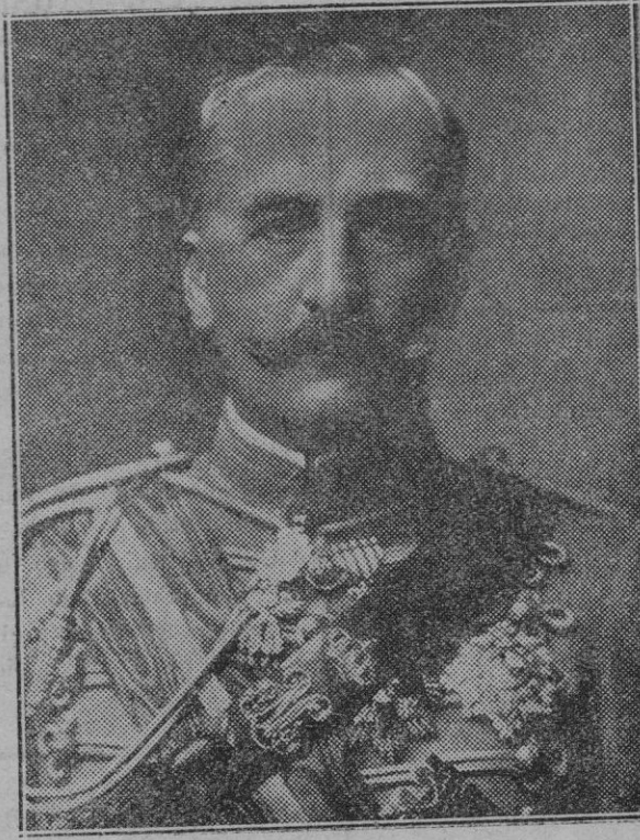
S. A. R. el Infante Don Carlos, que ha sido nombrado Inspector General del Ejército.

Por tanto, siendo ya más de tres los inscritos deberán celebrarse series eliminatorias, las que tendrán lugar el domingo, día 7 del corriente y quedarán clasificados para la final los tres corredores que cubran los 25 kms. de la serie en menos tiempo.