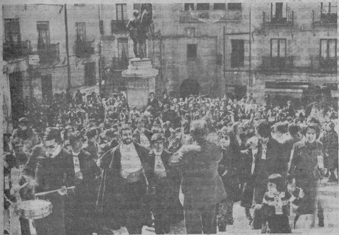
Un momento del recorrido efectuado por folkloristas y numeroso público con motivo de la presentación del disco de Mariano San Romualdo «Fiesta en Castilla».

Homenaje al popular dulzainero con la presentación de su disco