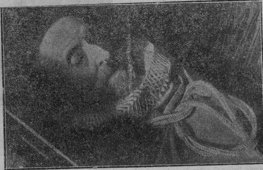
Madrid. — El fallecimiento del general Weyler. El Príncipe de la Milicia en la cámara mortuoria envuelto con el hábito del Santo Sepulcro.

Al sonar el pistoletazo, Topsy quedó parado y cuando se decide a correr ya los otros iban a vanguardia; Sextius sobre quien pesaba el enorme handicap se lanza con coraje sin ver premiado su esfuerzo. Niraní que desde el principio se ha pasado a la cuerda pasa la meta, habiendo invertido en el recorrido 57 1/5, Yampar 57 3/5, Limeño 58 2/5 y Sextius 53 2/5.