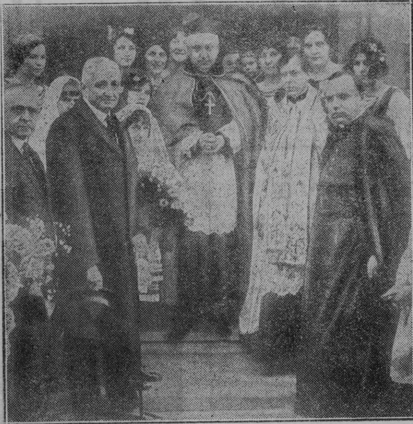
Londres. — El Cardenal Hlond, Prímado de Polonia al salir de inaugurar la nueva iglesia católica levantada por la colonia polonesa en Islington.

Nuestro Excmo. Prelado ha nombrado a este fin una junta de distinguidas damas de esta ciudad que han comen-