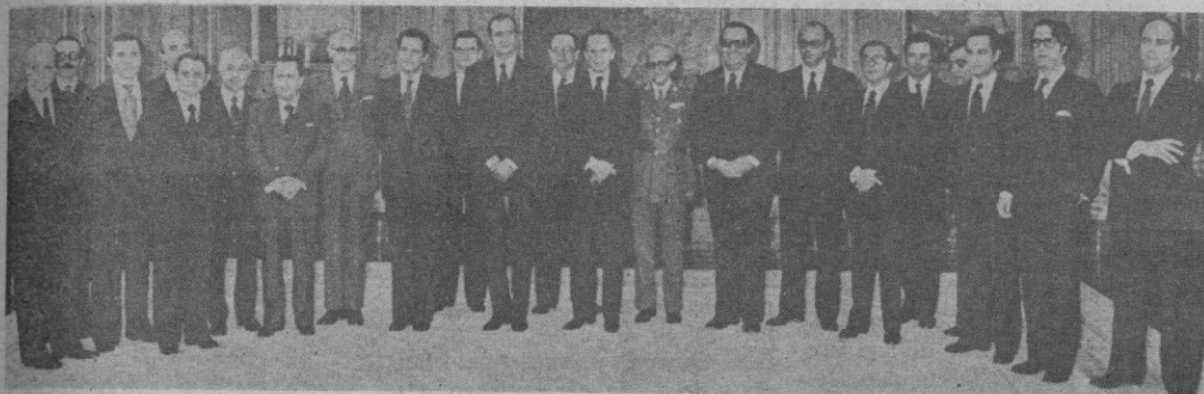
Una vez jurados sus cargos, los componentes del tercer Gobierno de la Monarquía se fotografiaron junto a S. M. don Juan Carlos.