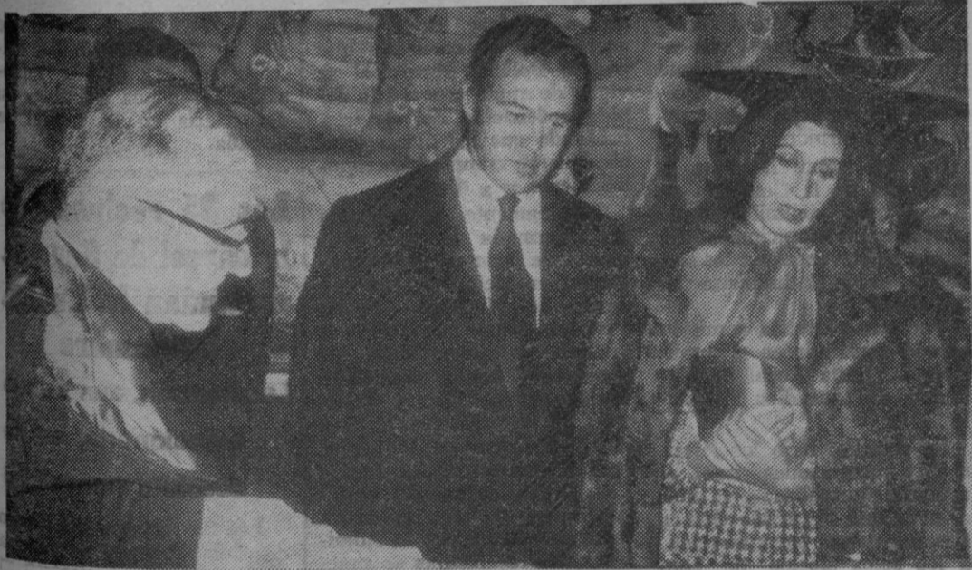
Los Duques de Cádiz escuchan las explicaciones sobre las características de los libros y documentos expuestos en la sala capitular de la catedral

pal del templo. Sus Altezas Reales fueron saludadas y cumplimentadas por el gobernador civil, gobernador militar, general presidente del Patronato del Alcázar, presidente y fiscal de la Audiencia, presidente de la Diputación, alcalde de la ciudad y otras personalidades, así como por los diplomáticos iberoamericanos, mientras el público estacionado en los alrededores prorrumplía en cariñosos aplausos. Después, los duques de Cádiz recibieron el saludo de los miembros de las corporaciones municipal y provincial. Una vez en el interior del templo, el obispo de la diócesis, al que acompañaba el cabildo, les ofreció agua bendita. Se formó seguidamente una comitiva hasta el claustro, que aparecía artísticamente iluminado y Sus Altezas contemplaron du-