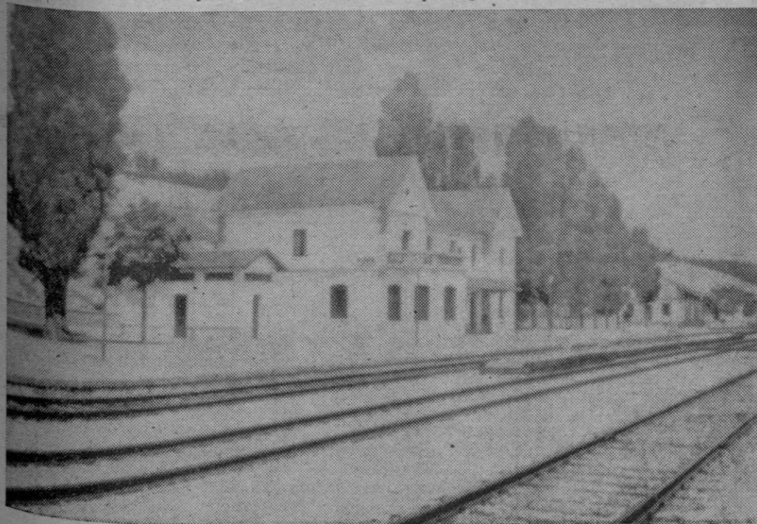
Una vista de la estación de ferrocarril