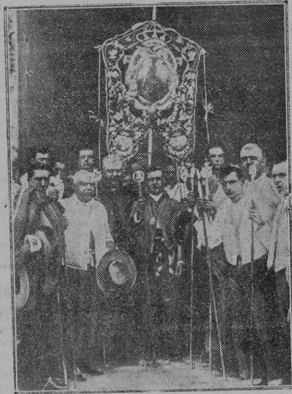
Sevilla. — El venerado estandarte conocido por el "Sinpecado", al salir de la iglesia de San Jacinto para ser conducido al Santuario donde se celebra la típica romería del Rocío.

Suscripción abierta por el Colegio de Procuradores 54'00 Banco Catalán Hipotecario 50'00 D. Antonio Jaume 2'00 Suscripción abierta en el Hotel Suizo 70'85