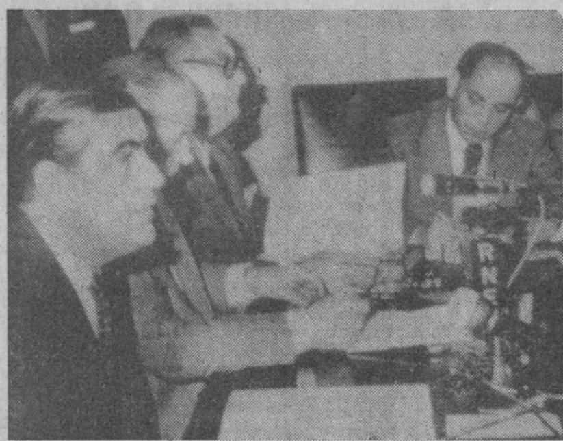
El ministro de Información y Turismo, don Fernando de Liñán y Zofío, durante la ampliación de la referencia de lo tratado ayer en el Consejo de Ministros

Algunas de las medidas que van a adoptarse tienden a la acción selectiva sobre ciertos productos o familias de productos. Por lo que respecta a los productos industriales, las posibles subidas tendrán que estar fundamentadas en función de posibles elevaciones de precios en las materias primas o en los salarios, con unos límites necesarios. En los productos agrícolas hay distintos criterios de aplicación, según sean productos de campaña o no. Los primeros no podrán crecer más de un 6,25 por ciento, y los segundos, más del 6 por ciento.