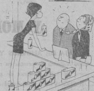
—Es muy bueno para limpiar toda clase de superficies lisas...