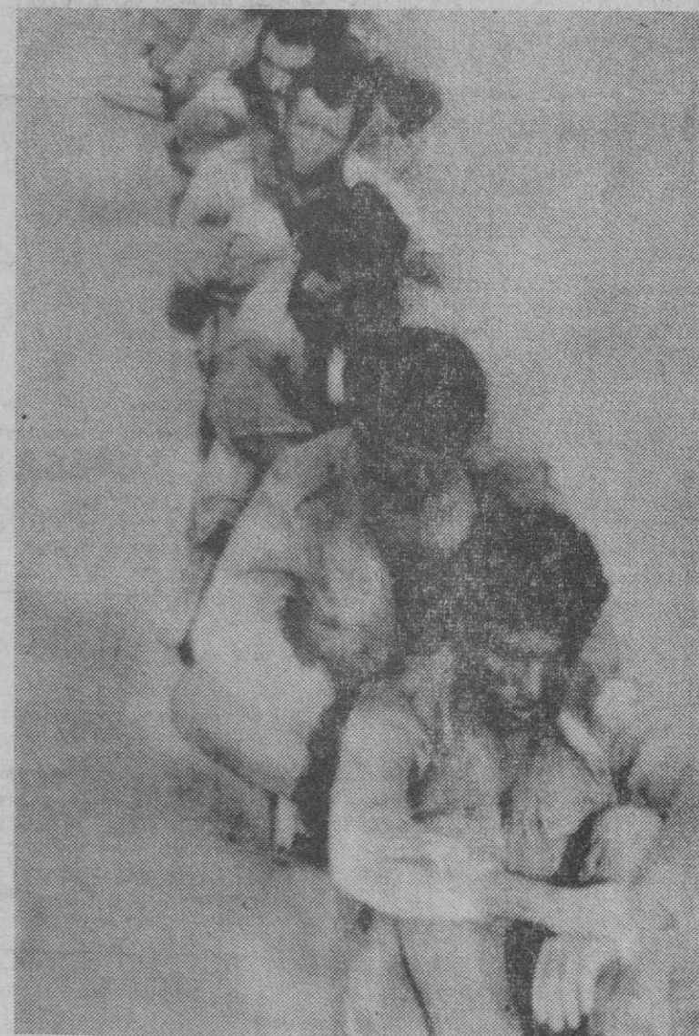
Mientras continúan desarrollándose los combates árabes-israelíes en distintos frentes, llegan fotografías de los prisioneros que uno y otro bando van consiguiendo. En ésta, un grupo de soldados judíos detenidos en el Sinaí

En el caso especial de la Universidad de Barcelona la implantación del nuevo calendario ha sido solicitada por la propia universidad para todos los cursos, con el propósito de beneficiar a los alumnos, facilitando a los suspendidos, en número elevado durante el curso pasado, la posibilidad de recuperar asignaturas antes de que comiencen las clases.—Cifra.