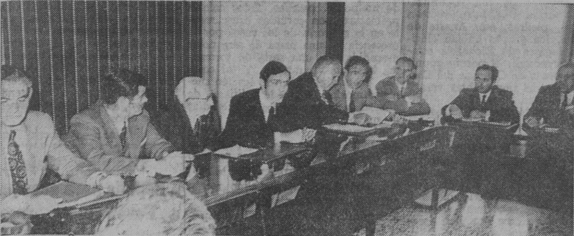
A primera hora de esta mañana se han iniciado en la Casa Sindical las sesiones de trabajo de los dirigentes sociales nacionales del Sindicato de la Madera y Corcho. Los asistentes a las mismas—en número de 50—son miembros de la Comisión permanente de la Unión Central de Trabajadores y Técnicos del citado Sindicato. Como ya informamos, estas reuniones se prolongarán hasta el próximo miércoles.

Se prolongarán hasta el miércoles y asiste medio centenar de trabajadores y técnicos