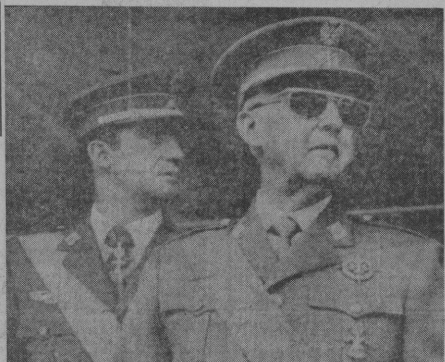
Su Excelencia el Jefe del Estado, acompañado del Príncipe de España, presidiendo el desfile de la Victoria

El espléndido día primaveral y la magnífica temperatura, han contribuido a la masiva asistencia de madrileños a este trigésimocuarto desfile conmemorativo de la Victoria.—Cifra.