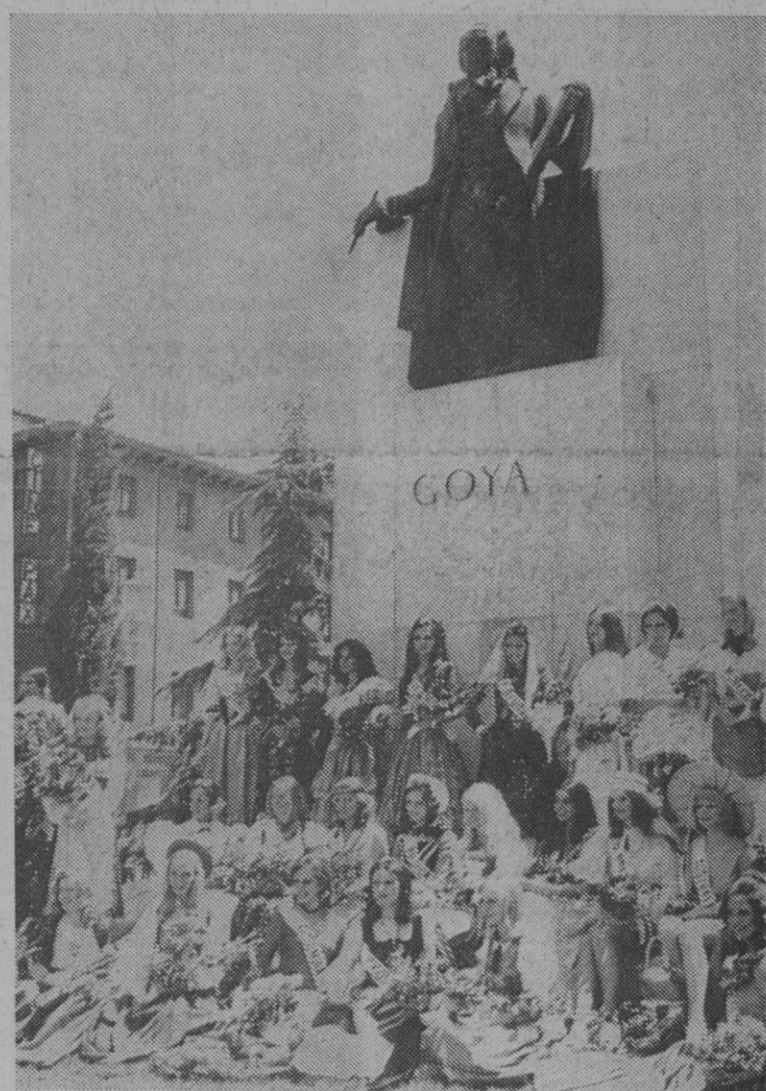
Zaragoza.—Durante su visita a la capital del Ebro, las majas participantes en el concurso de «Maja Internacional» posan delante del monumento dedicado al pintor Goya.