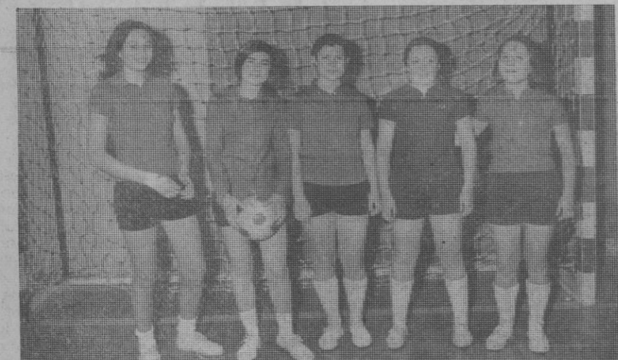
Dos equipos de cinco jugadoras cada uno, formados por alumnas del Instituto Nacional de Enseñanza Media Femenino, han celebrado un original encuentro de fútbol en el pabellón deportivo «Enrique Serichol». He aquí a las componentes de ambos conjuntos.