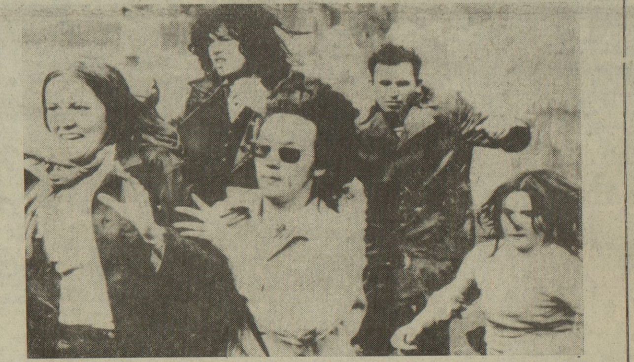
Frankfurt.—Un grupo de manifestantes corre para alejarse de los chorros de agua que les lanza un tanque antimanifestaciones, cuando éstos marchaban por las calles de la ciudad como protesta por las medidas sobre viviendas pronunciadas recientemente por el Ayuntamiento. Varios manifestantes y policías resultaron heridos en la manifestación.