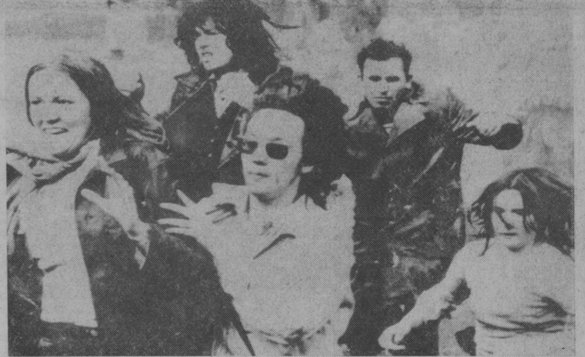
Frankfurt.—Un grupo de manifestantes corre para alejarse de los chorros de agua que les lanza un tanque antimanifestaciones, cuando éstos marchaban por las calles de la ciudad como protesta por las medidas sobre viviendas pronunciadas recientemente por el Ayuntamiento. Varios manifestantes y policías resultaron heridos en la manifestación.