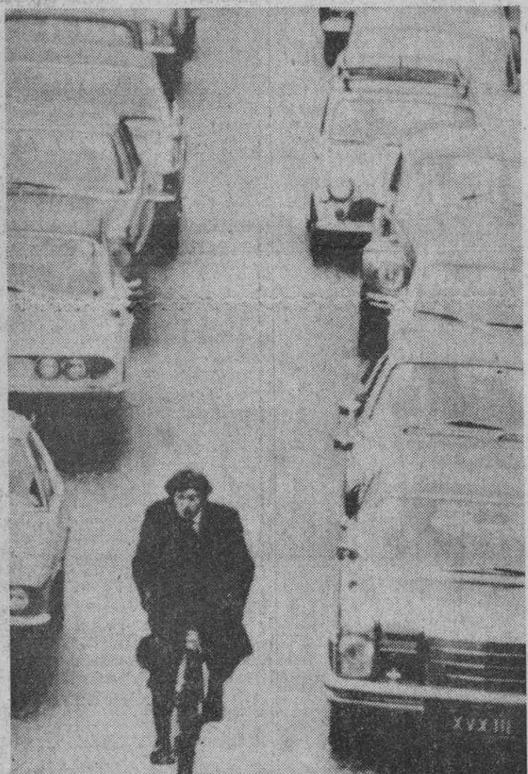
Los atascos se sucedieron en las calles de Londres al sumarse los ferroviarios a las huelgas decretadas por empleados del gas, profesores de enseñanza primaria y media y algunos sectores de la industria del automóvil, que protestan contra la política inflacionista.

La Jefatura Superior de Policía de Madrid ha prohibido, mientras duran las circunstancias actuales, un acto de confraternidad hispano-rumana que se iba a celebrar esta tarde en los locales de la revista «Fuerza Nueva», según ha sabido un redactor de «Ya».