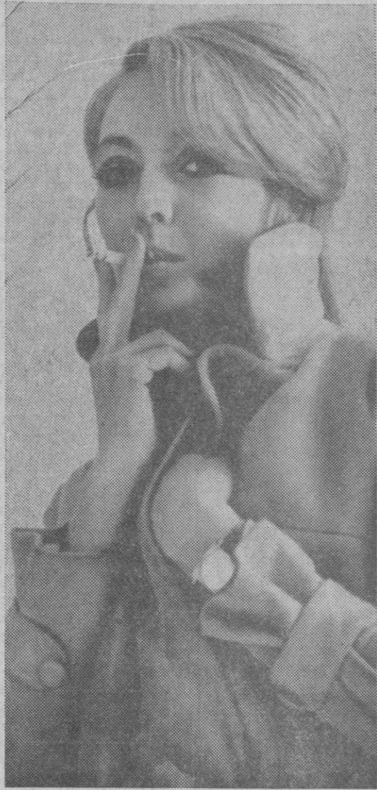
Los psicólogos alemanes han inventado un eficaz método para dejar el vicio de fumar.