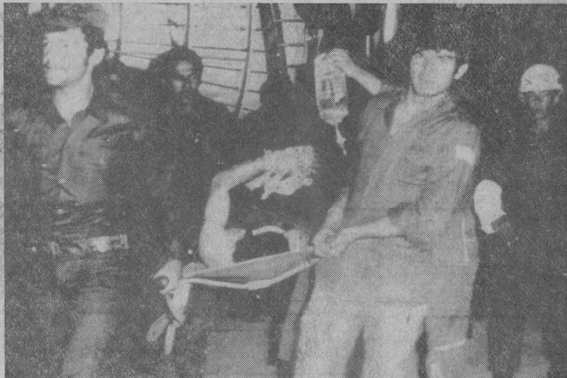
Sinaí.—Un grupo de soldados israelíes, transportan a un hospital de Sinaí a los supervivientes del avión comercial libanés derribado por cazas israelíes.—(Telefoto AP - Europa Press)

Tripoli, 23.—Grupos de manifestantes irrumpieron en los accesos de la Embajada U. S. A. en esta ciudad, anoche, y quemaron la bandera estadounidense, según manifiestan testigos oculares. Los manifestantes protestaban contra el derribo de un avión libio de línea sobre el desierto del Sinaí. La Embajada U. S. A. en Tripoli está cerrada hoy, viernes, día de descanso musulmán, y no se dispone, por tanto, de comentario inmediato acerca del daño producido por los manifestantes. Un chófer de la Embajada, sin embargo, ha confirmado que los manifestantes arriaron la bandera U. S. A. y la quemaron. Y el daño se redujo a la rotura de ventanas.—Efe-Reuters.