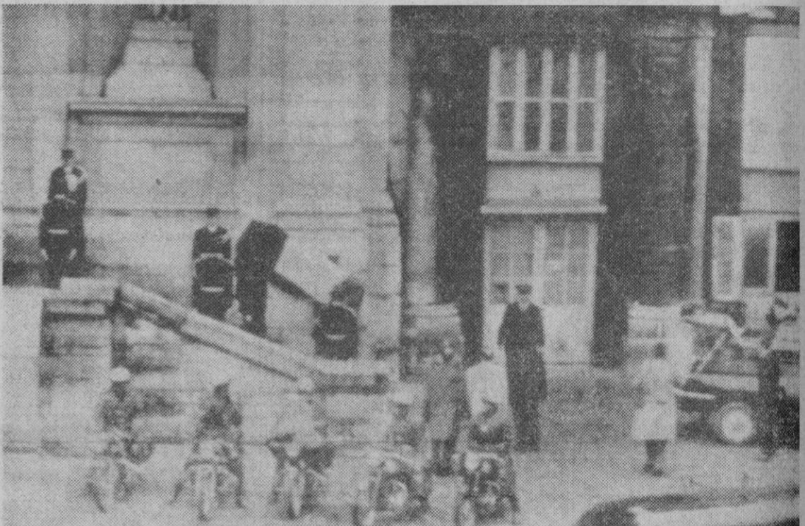
El ataúd que contiene los restos mortales del mariscal Petain, robado recientemente y recuperado de nuevo por la Policía francesa abandona el hospital militar de Val de Grave, camino de la isla de Yeu, de donde fueron sacados. El féretro fue encontrado en París. Los familiares han pedido que fueran devueltos a su primitivo enterramiento.