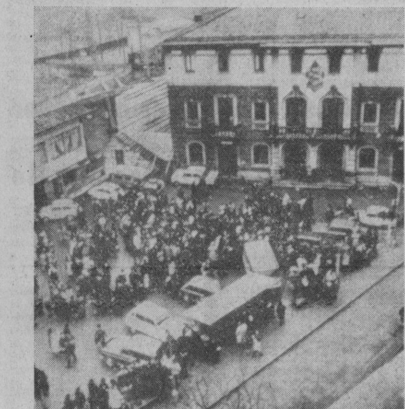
En Ortuella, Vizcaya, unas 400 personas, en su mayoría mujeres, se manifestaron pacíficamente para protestar contra la contaminación atmosférica existente en el pueblo. Una comisión visitó al alcalde en solicitud de que un horno de calcinado que vierte su polvo de carbono sobre la localidad, sea reparado convenientemente. En definitiva, una escaramuza más en la lucha contra la polución.