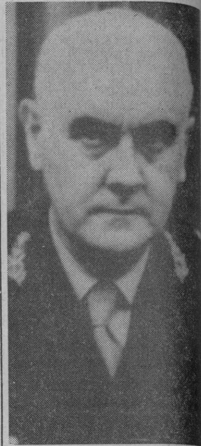
El presidente argentino, teniente general Lanusse

Buenos Aires, 24.—Horas de incertidumbre acerca del futuro del proceso institucionalizador de la República argentina se viven en esta capital invadida por una ola de rumores que van desde la posible postergación anulación de las elecciones previstas para el 11 de marzo próximo hasta la dimisión del presidente de la nación, teniente general Alejandro Agustín Lanusse.—Efe.