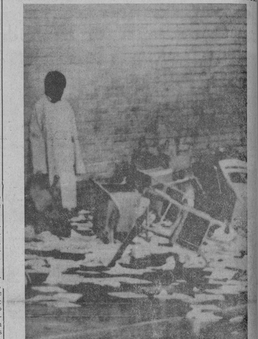
Este pequeño alumno de la escuela de Langston, en San Luis (Missouri), mira los muebles de la escuela, destrozados por el mismo y sus jóvenes compañeros en un ataque de ira de profundísimas raíces. Los niños, aprovechando la ausencia de profesores debida a una huelga, irrumpieron en el local, destruyendo todo lo que encontraron