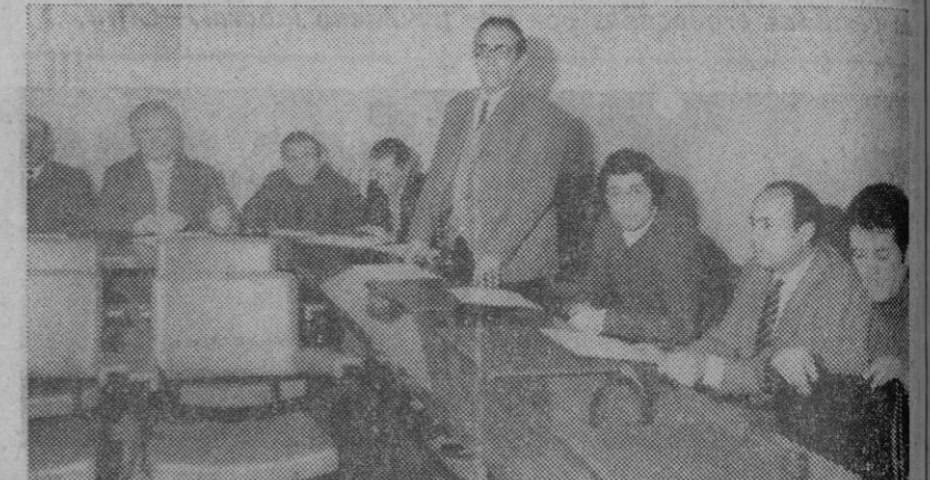
Uno de los trabajadores que han asistido como alumnos al curso celebrado en Segovia pronunciando unas palabras de agradecimiento por la oportunidad que se les ha brindado para conseguir el certificado de estudios primarios.

la Organización Sindical. En total han sido veinte los cursos programados, capacitándose a más de 300 alumnos, residentes en la capital, en catorce localidades de la provincia. La inversión económica de la Organización Sindical ha superado las 350.000 pesetas.