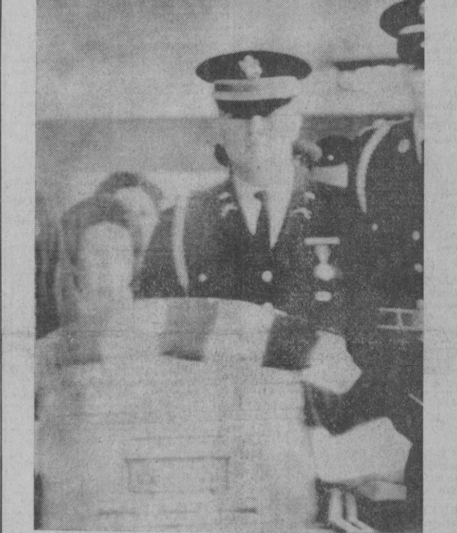
Austin.—Lady Bird Johnson, viuda del expresidente, detrás del féretro que contiene los restos de su esposo, cuando se iba a instalar la capilla ardiente en la biblioteca de la Universidad de Texas, en Austin.

Bilbao, 25.—Jornada explosiva la que se ha desarrollado hoy en la Bolsa bilbaína. Esta vez, a la impresionante alza en el corro bancario ha seguido la del grupo siderúrgico, donde se han producido plusvalías importantísimas, en un ambiente de euforia y brío hace años no visto.—Cifra.