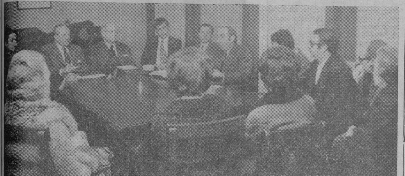
El secretario nacional de la Cruz Roja, reunido con los miembros de la Asamblea Provincial.

En la tarde de ayer llegó a nuestra ciudad el secretario general de la Cruz Roja Española acompañado del director nacional de la Cruz Roja de la Juventud, para reunirse con la Asamblea Provincial de dicha institución a fin de programar el plan de trabajo para el trienio 1973-75. Se trataron, entre otros temas de actualidad, el de los puestos de socorro en carretera, que serán atendidos diariamente por el personal de la Brigada de Tropas de Socorro, a partir de este reemplazo, los domingos y festivos por el personal voluntario, con la instalación de un puesto permanente en las inmediaciones de la autopista a su paso por Villacastín. Asimismo, se trató de la continuación de las actividades de la Cruz Roja de la Juventud, y de la creación de nuevos cursos de socorristas a través de la Inspección de este Servicio.