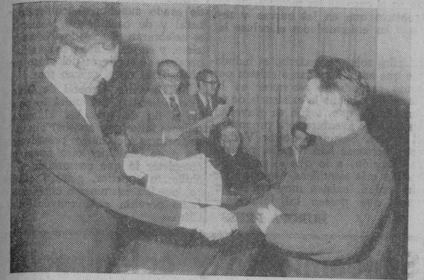
El delegado provincial de la Organización Sindical entregando uno de los premios.

COMUNICADOS Esta tarde en la Obra Cultural de la Caja de Ahorros y Monte de Piedad de Segovia, conferencia del P. Agustín Arredondo, S. J., sobre el tema «Paradojas del Desarrollo Económico social, el Consumo». Entrada libre.