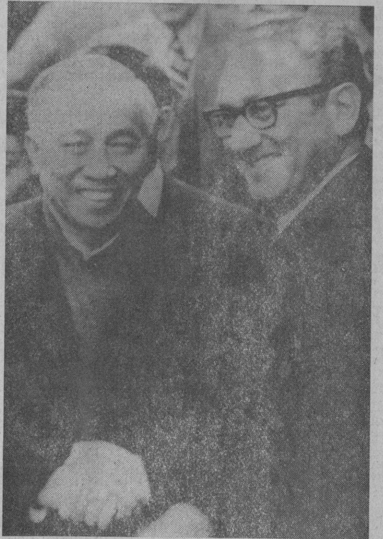
Efusivo apretón de manos entre Kissinger y Le Duc Tho ayer en París. Al término de su conversación, todos los supuestos indicaban que el «alto el fuego» en Vietnam había sido rubricado.