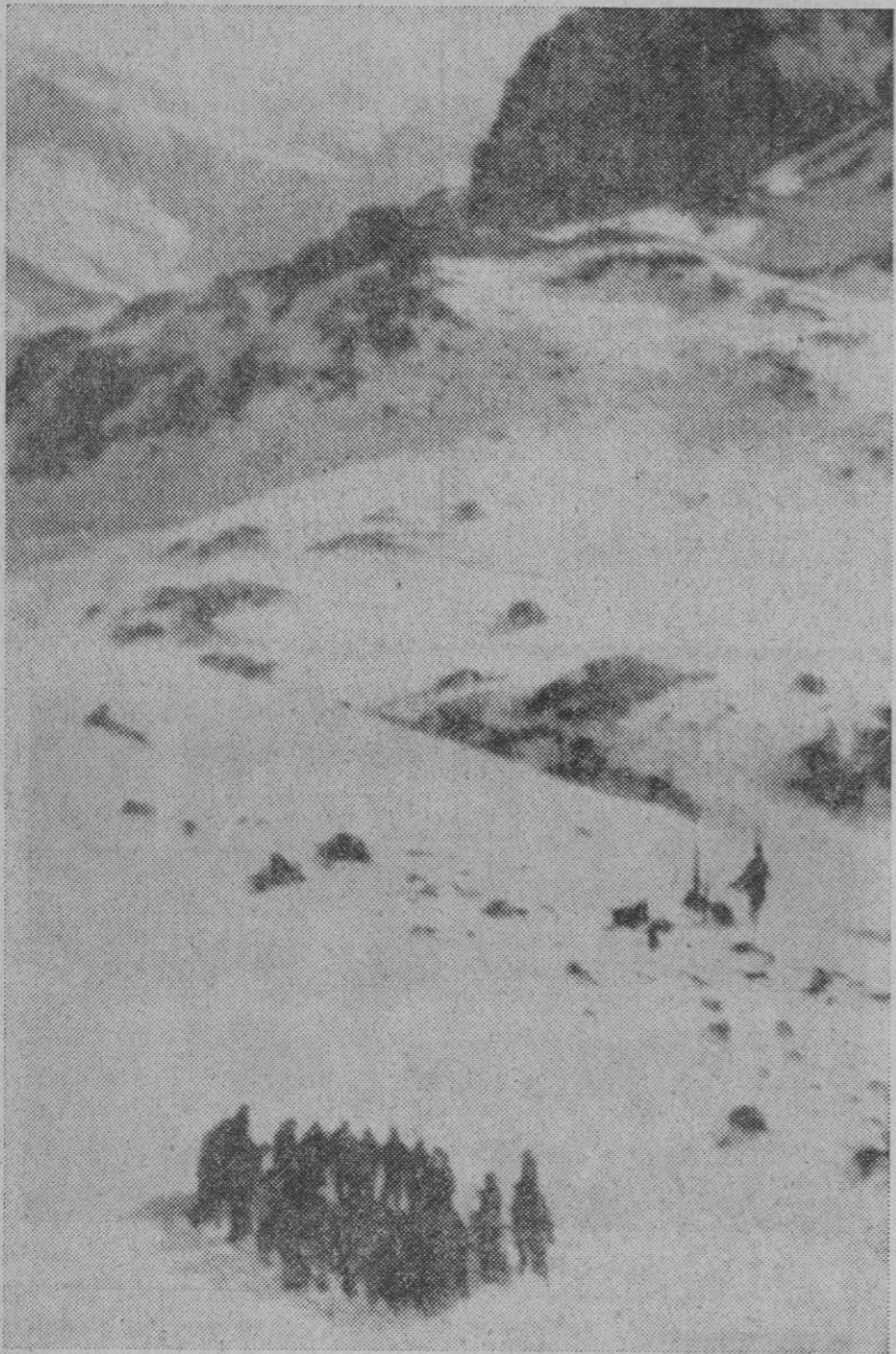
Tras fatigosa y persistente búsqueda, una patrulla de rescate encuentra a los dos montañeros perdidos. Por desgracia, ambos estaban muertos. En la telefeto de Cifra, la patrulla rodea a los dos cuerpos.