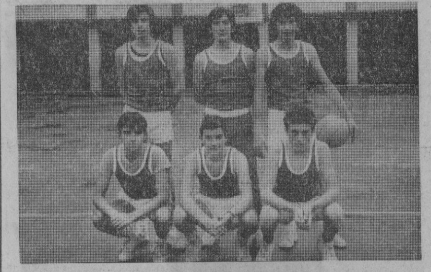
Equipo B del Imperio de baloncesto