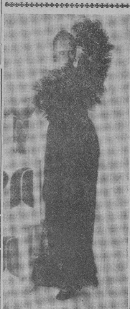
Fino encaje de algodón negro para traje de escote asimétrico, con volantes en el escote, manga y bajo.