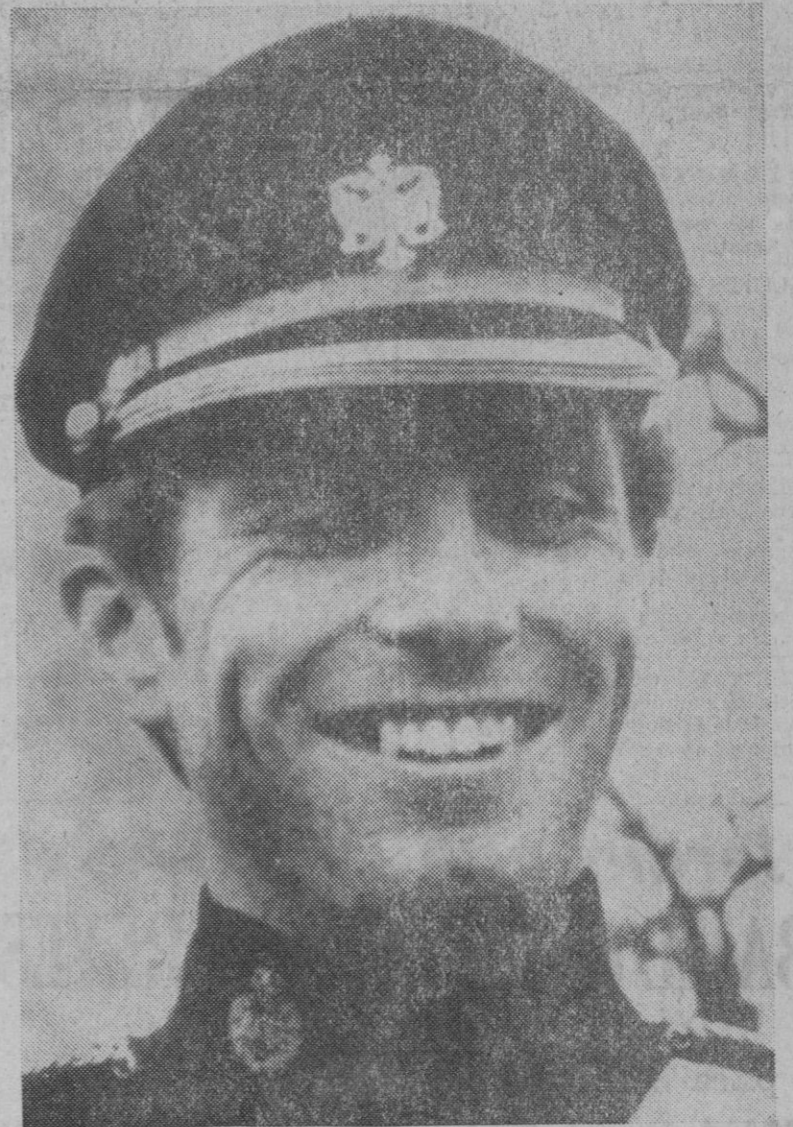
Londres.—Foto de Mark Philips, de 24 años, ganador de la medalla de oro en saltos hípicos en la última olimpiada de Munich, cuyo nombre viene a unirse románticamente al de la princesa Ana. El palacio de Buckingham ha confirmado que Mark había pasado las fiestas de año nuevo con la familia real en Sandringham.