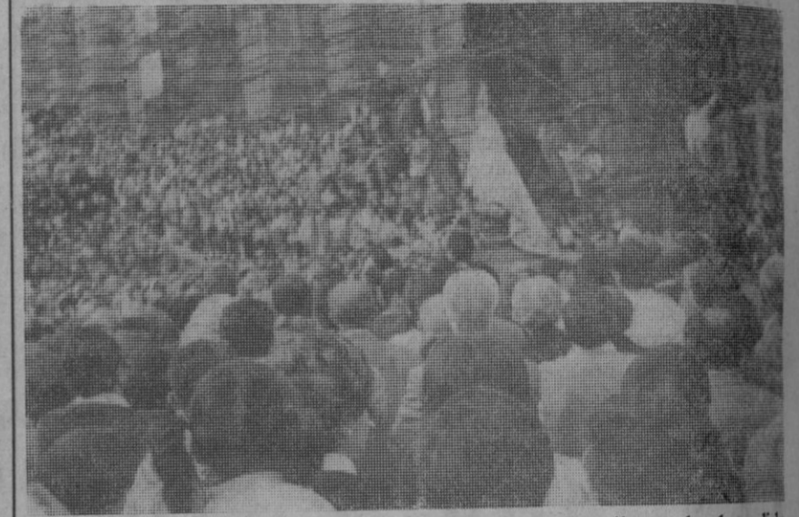
Una muchedumbre se concentró en el Azoguejo para tributar la despedida oficial a la sagrada imagen.

Entre los aplausos del público entró la sagrada imagen en el Azoguejo colocándose dando frente a la