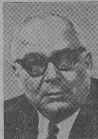
Mohamed Zayyat, nuevo ministro egipcio de Asuntos Exteriores, actualmente en viaje por Europa, para lograr apoyo de la Europa Occidental a la intención egipcia de mantener su independencia en las relaciones con la Unión Soviética.