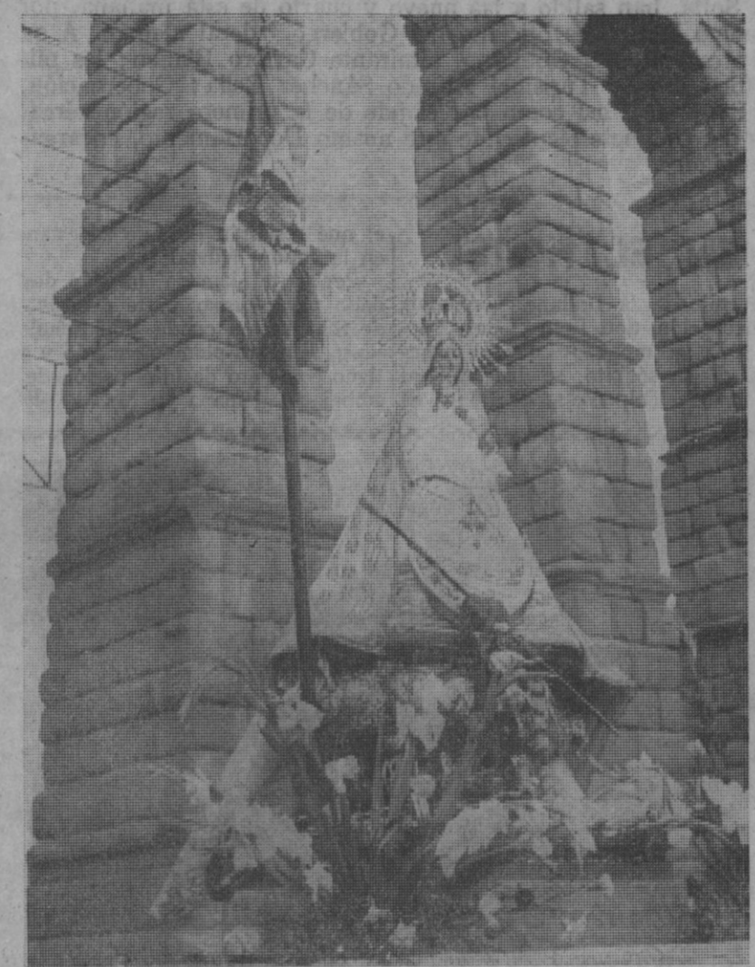
La imagen de la Virgen a su paso bajo el acueducto

La alameda del santuario registraba asimismo una gran afluencia de personas, que tributaron un cariñoso recibimiento a la sagrada ima-