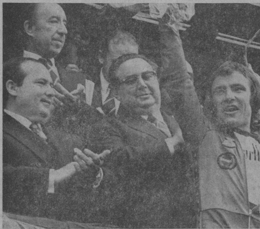
Barcelona.—El gran piloto español Angel Nieto en una gran proeza realizada el sábado en Montjuich consiguió adjudicarse los triunfos en los campeonatos mundiales de 125 y 50 cc. En la primera prueba, por la mañana, se clasificó tercero, (con un octavo puesto le bastaba). Por la tarde, gran triunfo en 50 cc., marchando toda la carrera en primera posición delante de Devries, su más directo rival.

El nuevo campo petrolífero de la «Mobil Oil North Sea», se encuentra a 100 millas al este de las islas escocesas Shetland.