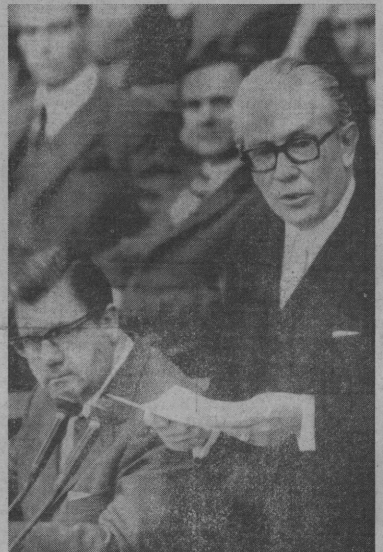
Bonn.—El presidente del Bundestag, Kai-Uwe von Hassel, anuncia el resultado de la votación al voto de confianza presentado por el canciller de la República, que resultó desfavorable por lo que el Parlamento ha quedado disuelto y nuevas elecciones convocadas.—(Telefoto AP-Europa Press.)

El mal tiempo impidió en varios lugares la celebración de esta manifestación con antorchas. En Bergen, por ejemplo, sólo acudieron a ella 200 manifestantes.—Efe-Reuter.