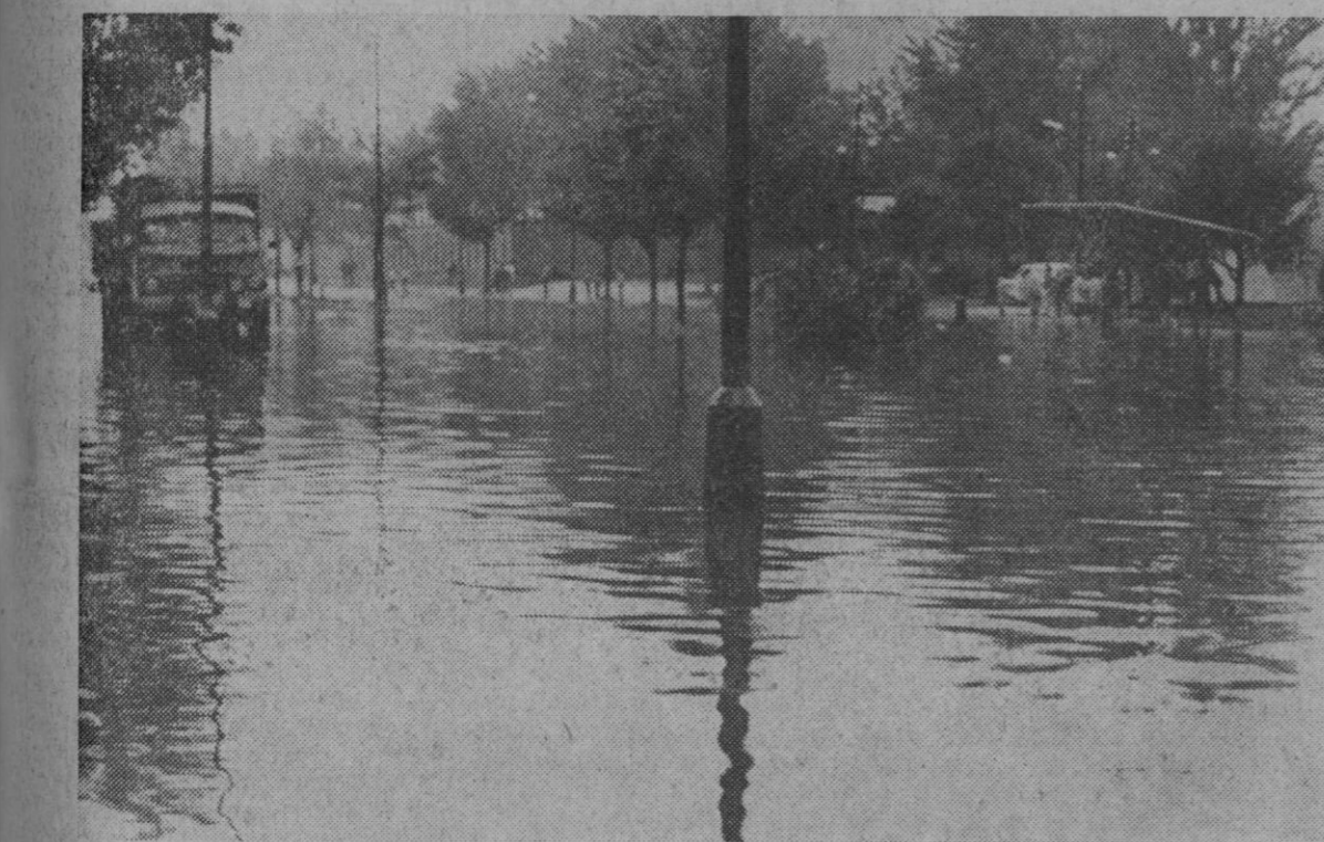
Madrid.—En el barrio de Villaverde, la zona quedó totalmente anegada de agua, los peatones se las vieron y desearon para poder llegar a los medios de transporte que les llevaran a su trabajo. Los bomberos hubieron de realizar innumerables salidas debido a la fuerte tromba caída a primeras horas de la mañana.

«Radio Tanzania» anunció anteriormente que uno de sus corresponsales en la zona fronteriza había informado por la mañana que todo se hallaba en calma.—Efe-Reuter.