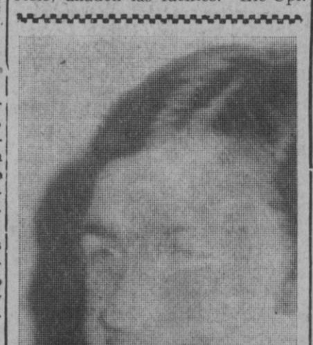
Sevilla.—Los nueve vendedores de una casa comercial en Sevilla rellenaron su boleto y han acertado una de 14, 8 de 13, y 25 de doce. En la foto, el autor del "pleno".

En una información fechada en Damasco, el diario comenta que los sirios están animando a los comandos cuyas bases están en Siria, para que aumenten sus ataques contra Israel.