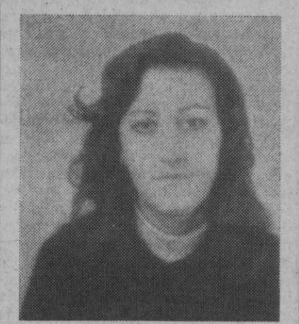
La reina de las fiestas de Cabezuela.

El conjunto Lambda, de Valladolid, actuará todos los días en el fr-