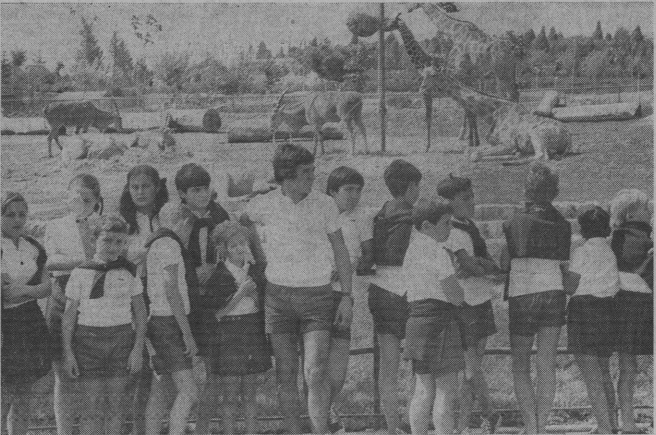
Madrid.—Los niños de la operación «Plus Ultra» han visitado el parque zoológico de la Casa de Campo de Madrid, momento que recoge la fotografía.

El periódico publica también un amplio reportaje del nuevo Centro Español, que se inaugurará a principios del año próximo y que contendrá una Exposición permanente de la artesanía española, agencia de viajes y Cine España.—Efe.