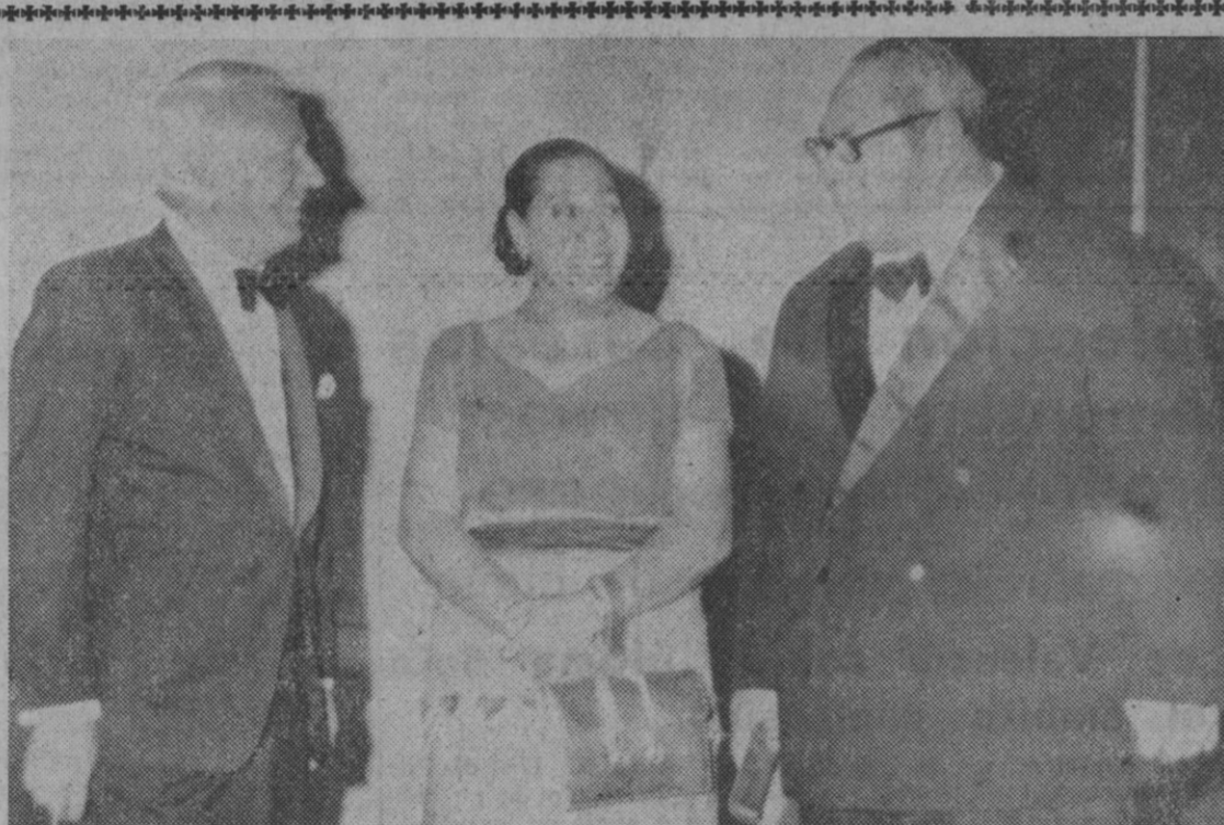
Londres.—El primer ministro británico, Mr. Heath, saluda al rey Taufa Ahau Tupou y a la reina Mata Aho, de la isla de Tonga a su llegada a Downing Street para cenar con el «premier».

En lo que se refiere a las relaciones comerciales hispano-soviéticas, es de destacar el fuerte impulso que han experimentado en el año en curso. Concretamente en enero-junio España importó de la URSS productos por valor de 685,4 millones de pesetas (912,4 millones en el conjunto del año 1971), y exportó a ese país por valor de 1.337,6 millones (en 1971, 691,2 millones). Con estas cifras, Rusia ha pasado a convertirse en el primer cliente español entre los países del Este europeo.—E. Press.