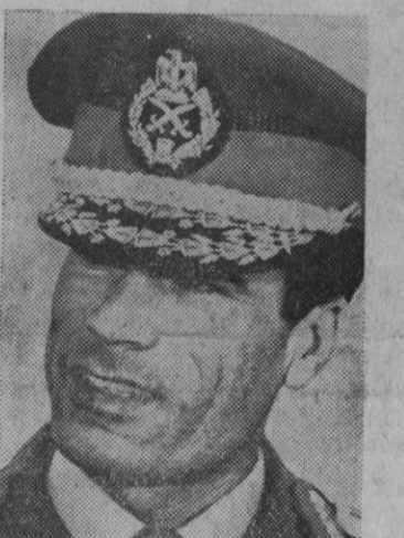
Moamar el Gaddafi