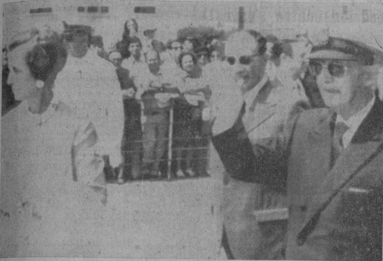
La Coruña.—Su Excelencia el Jefe del Estado, acompañado de su esposa corresponde a las aclamaciones del público a la llegada al Real Club Náutico de La Coruña para embarcar en el yate «Azor».