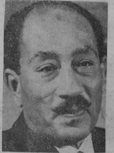
Anuar el Sadat

Los medios de información libios abogaron la pasada semana por la celebración de manifestaciones masivas a favor de la unión, a la que califican de hito en la historia moderna del mundo árabe.—Efe-Upi.