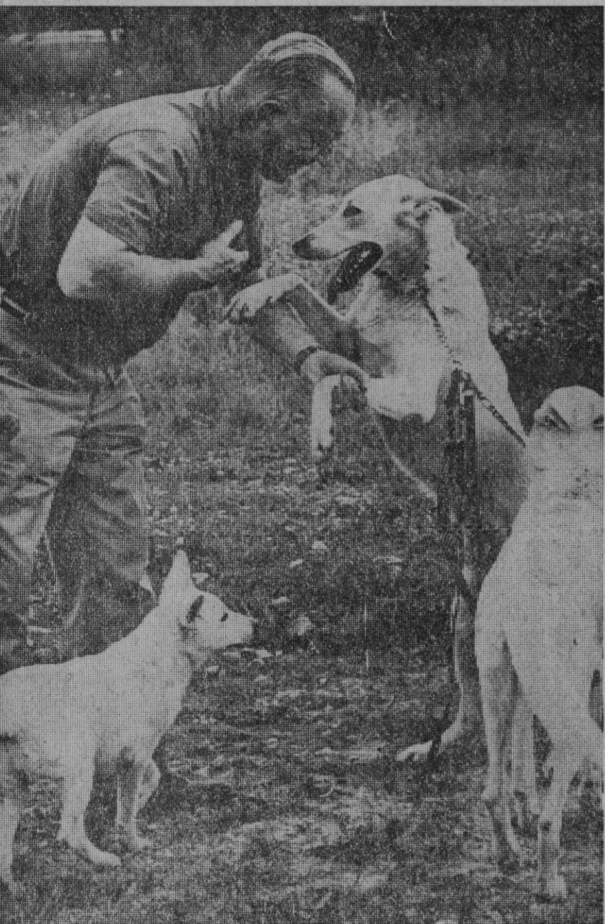
Todo el sistema de enseñar a los perros tiene una base sencilla. El animal debe acostumbrarse a cumplir órdenes elementales para luego pasar a cuestiones más complicadas. Pero el secreto de todo esto es que el perro relacione la orden con algo agradable, es decir que las palabras parezcan más una bienvenida que una orden. Los resultados serán prodigiosos siempre que el animal se acostumbre a obedecer las órdenes más sencillas.