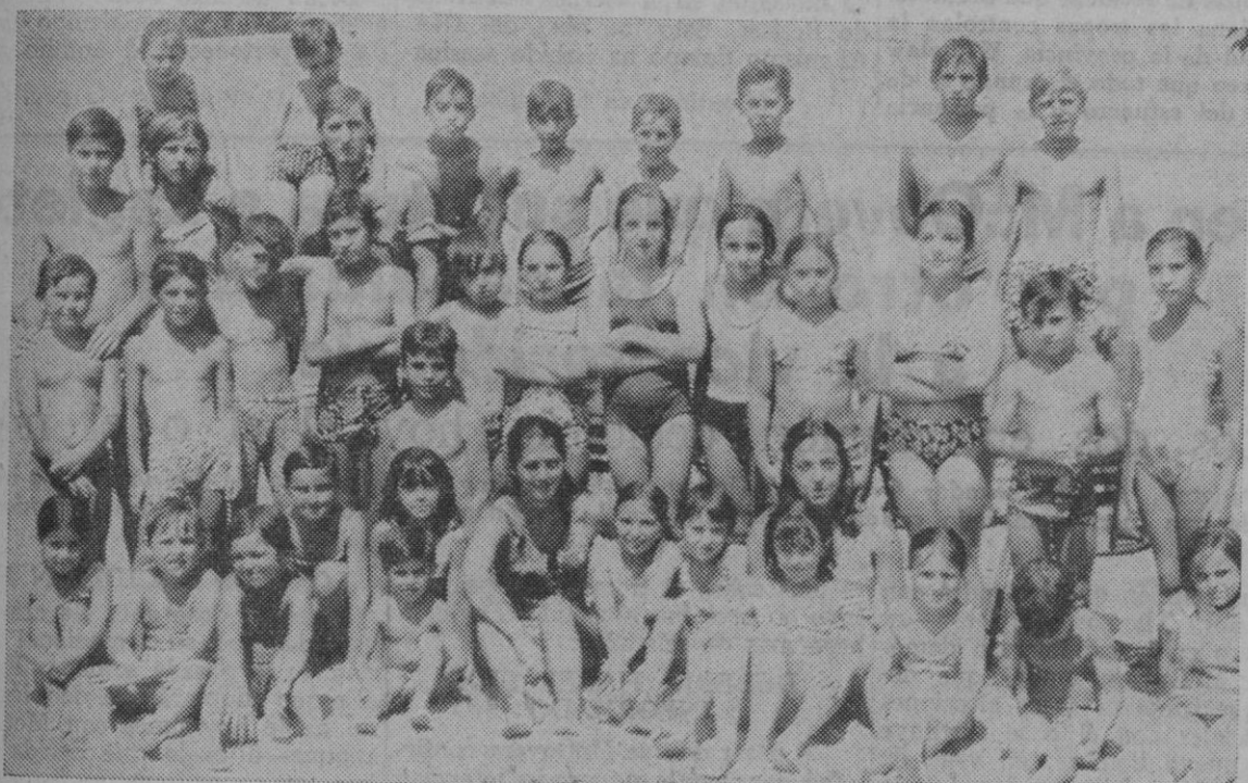
Los nuevos nadadores posan orgullosamente junto a sus profesores.